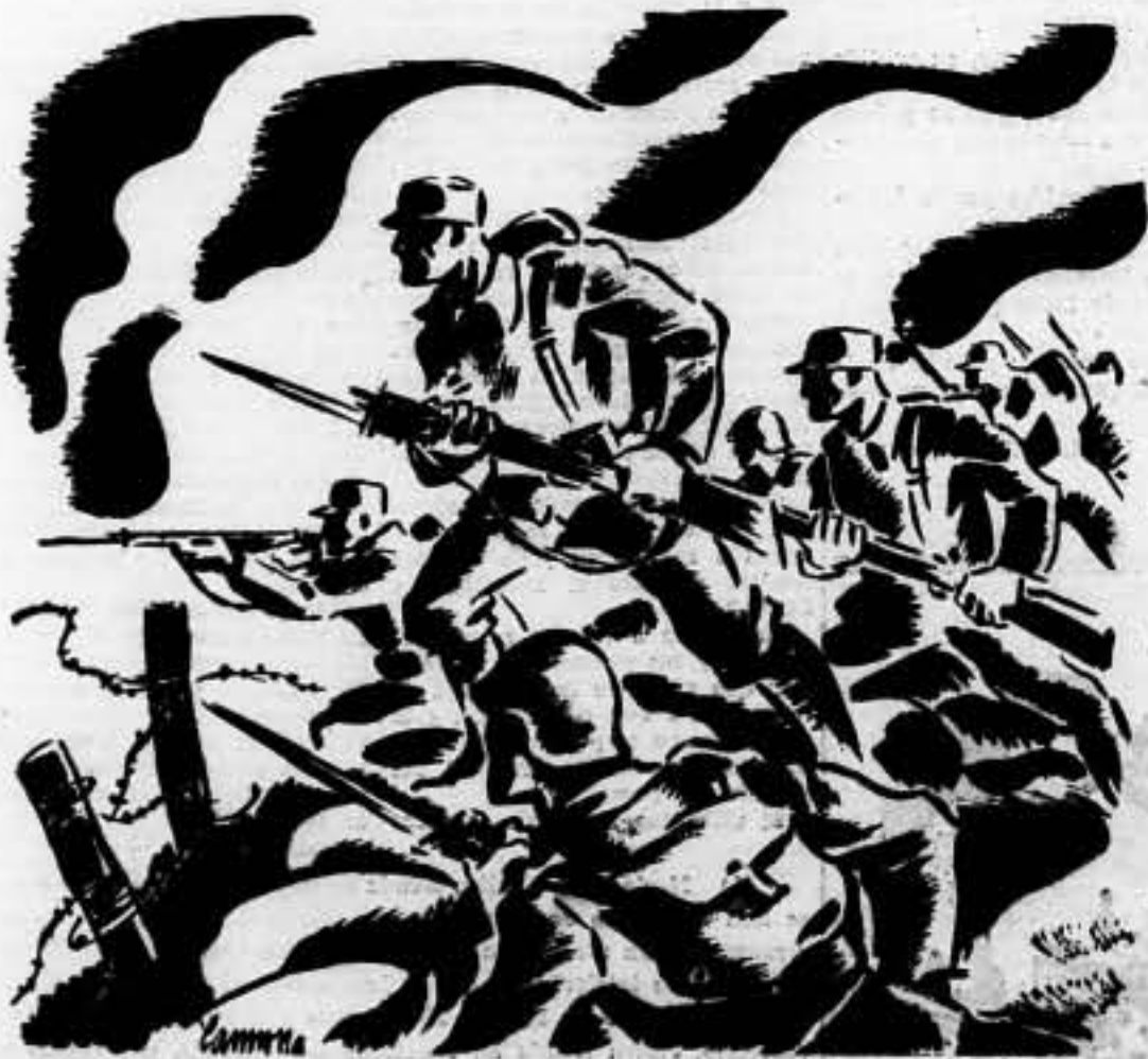
El derroche de material mortífero de los ejércitos invasores, lejos de demoralizar a los combatientes antifascistas les infunde más coraje, vuelve más acerada su voluntad de resistencia. Así, cada palmo de terreno cuesta centenares de víctimas a los invasores. Y cuando lo dispone el Mandato, nuestros soldados se lanzan bruscamente a contraatacar y reconquistar posiciones.