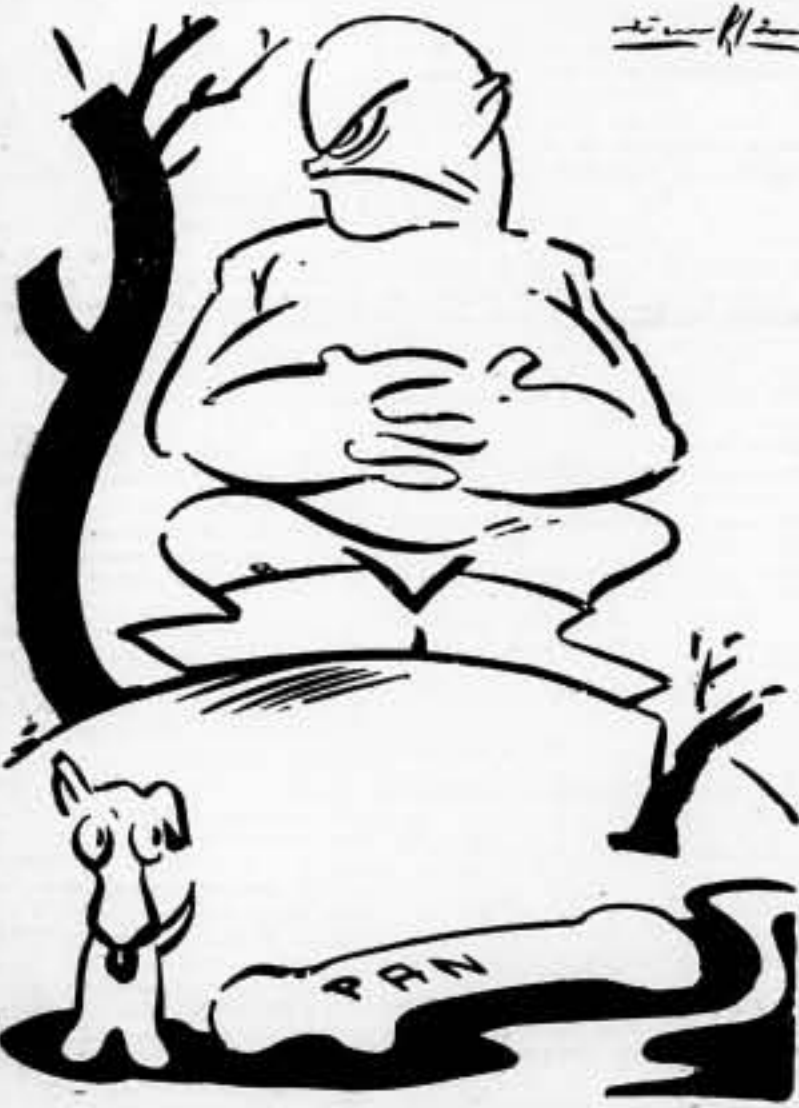
—¿Quién dijo que en Italia pasaban hambre?