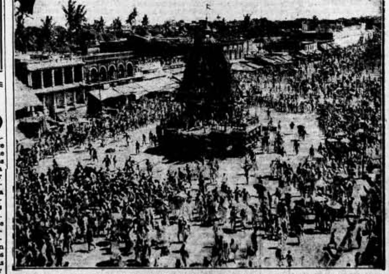
La fiesta anual de «Baha Jatra» (fiesta del carro). Millares de devotos hindúes arrastran un carro original, en el cual se encuentran varios personajes venerados por la masa.