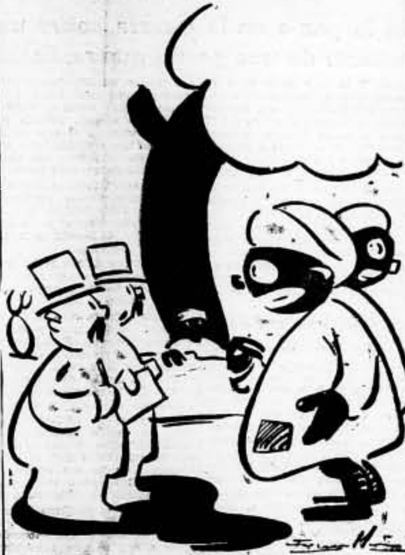
—¿De dónde sales? —Dico puto. Queigo por sevillanos españoles.