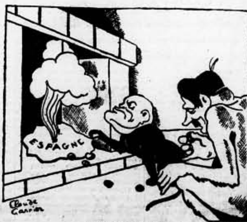
Las castañas del fuego

Bruselas, 21. — En un discurso que ha pronunciado el señor Spaak, en Berchemez Anvers, ha afirmado que la política exterior del Gobierno no ha cambiado desde 1936, agregando que el Gobierno ha mantenido la misma actitud de independencia y equilibrio, que es — dijo — la que mejor conviene para el mantenimiento de la paz. — Fabra