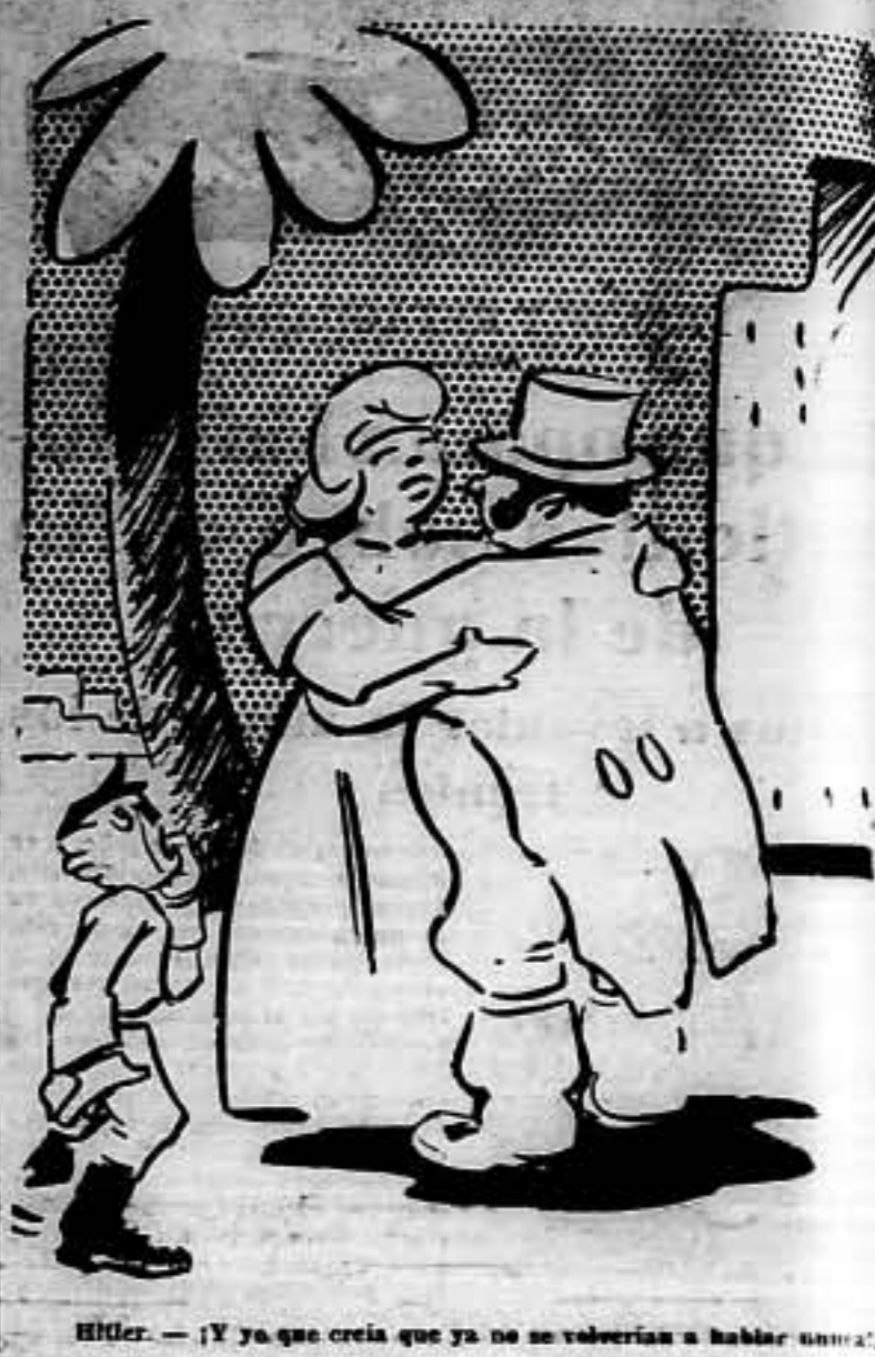
Hitler.— ¡Y ya que creía que ya no se volverían a hablar nunca!