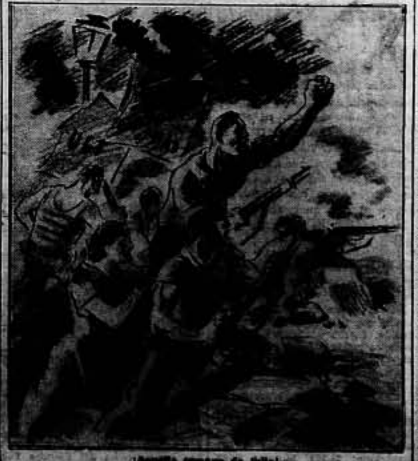
¡Aquella hazaña de julio!

Nunca pagarán los traidores que entregaron la nación austriaca a la ambición imperial de Berlín, el daño que han causado. Para los que abren las puertas de su patria a los ambiciosos extranjeros, ella, sólo puede existir el desprecio eterno de la Historia.