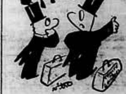
— Se haría más pronto contando los españoles y haciendo diferencia del total de tropas.

El subsecretario del «Foreign Office», Butler, contestó que el Gobierno inglés lamenta la presencia en España de combatientes de nacionalidad extranjera; pero de ser considerados como militares