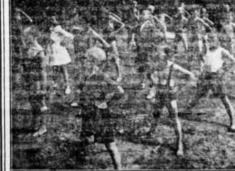
Cerrados los asilos infantiles y hundida en el fracaso la escuela confesional, los niños, liberados por la Revolución, lucen al sol y al aire sus cuerpecitos débiles, que la nueva Escuela se encarga de fortalecer físicamente y espiritualmente

Barcelona, 27 de julio de 1936.—Lluís Companys.—El consejero de Cultura, Ventura Gassol.