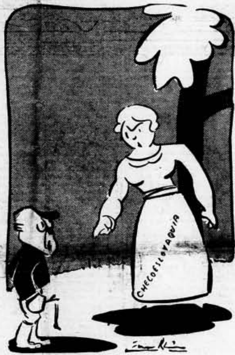
—Bueno; ¡para broma ya está bien! o ¿es que quieres que te rompa las nueces?