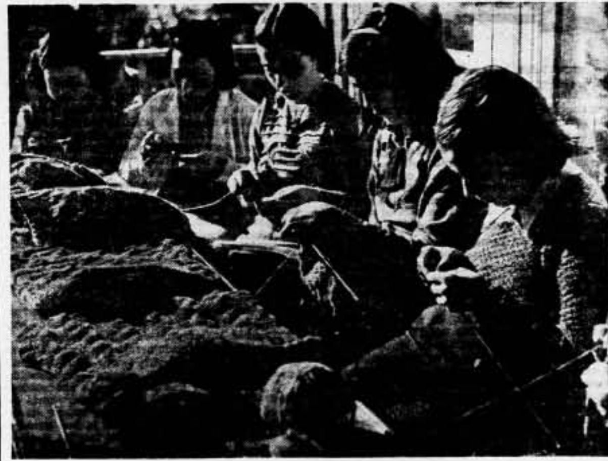
Nuestros combatientes tienen entre las jóvenes alumnas de la Escuela Natura sus mejores amigas. Helas aquí trabajando afanosas en la confección de prendas para los mismos

La misión que se encomienda a todos los jefes, comisarios, oficiales y soldados, es cumplir con su deber".