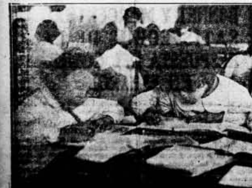
Me aquí la primera mansión que ocuparán los hombres del C. E. N. U. En este recinto se redactó el programa de la Escuela Nueva Unificada

Esta sería, a nuestro juicio, la mejor manera de solemnizar el aniversario. Y el Pueblo lo estimaría como una consagración de la más bella y fecunda de sus conquistas revolucionarias.