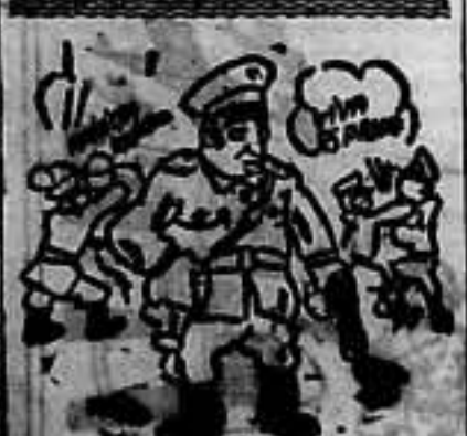
FRANCO. - Desobediencia a un general francés...

ante todo, que cuando llegue ese momento, China sea libre e independiente. Este es el pensamiento cardinal que en estos momentos absorbe al Pueblo chino.