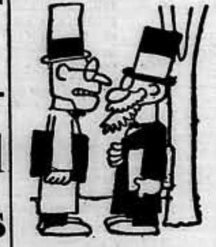
—¿Qué tal va eso? —Bien. Ahora se discute la retirada de la retirada.