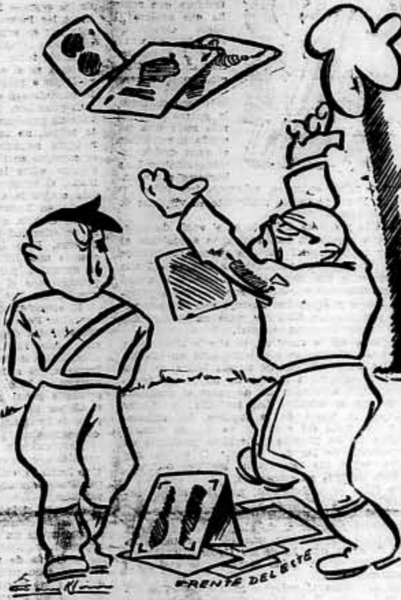
— ¡X para esto hemos trabajado tanto! —