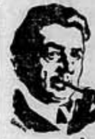
Herriot habla del incendio que arruina a España

París, 29. — El presidente de la Cámara, Herriot, al inaugurar la plaza de Israel, en Troyes, pronunció un discurso en el que se refirió a la situación internacional. "Nos encontramos entre el incendio y la tempestad —dijo Herriot—, incendio que arruina a España; tempestad que amenaza a Europa de mar inquietante. Debemos observar atentamente la situación." "Francia —añadió— puede contar con el patriotismo de sus ciudadanos. El Pueblo francés entero, como en los tiempos de la Revolución, demuestra su devoción por la bandera y por Francia." — Ag. España.