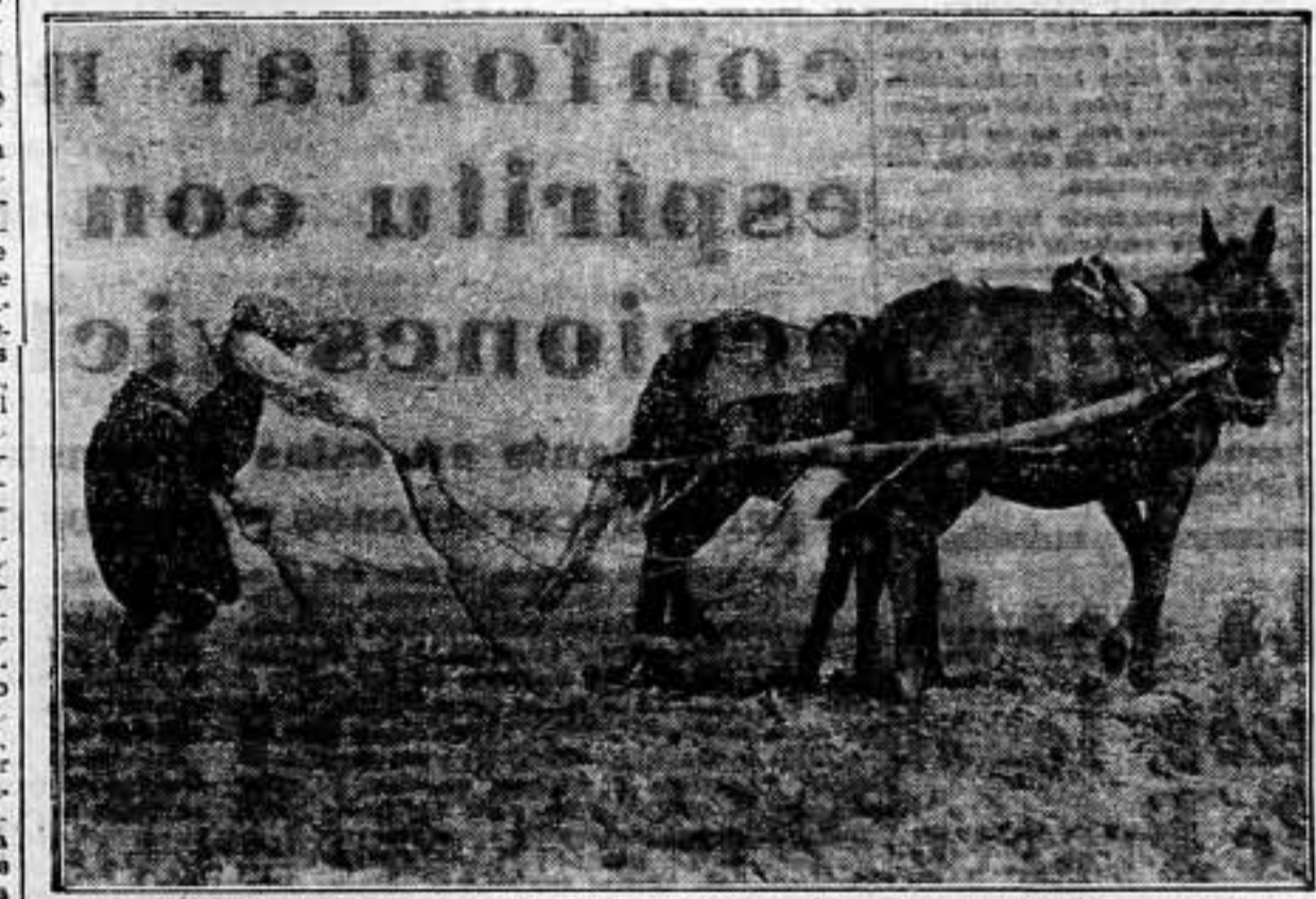
La continuidad y firmeza en la labor diaria de los trabajadores del campo, demuestran la confianza en el triunfo definitivo sobre las hordas fascistas