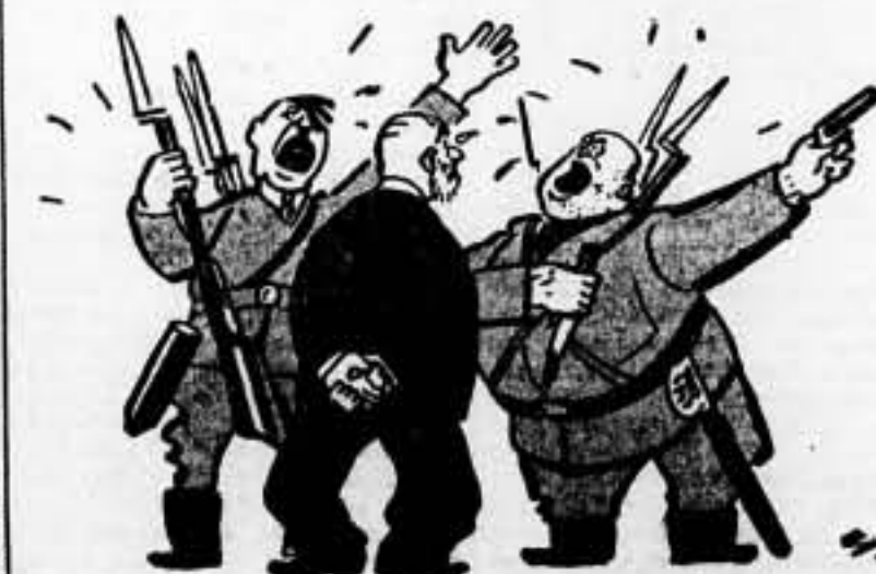
Y a todos los emisarios les dicen lo mismo: «¡Paz, nosotros no queremos más que paz!»