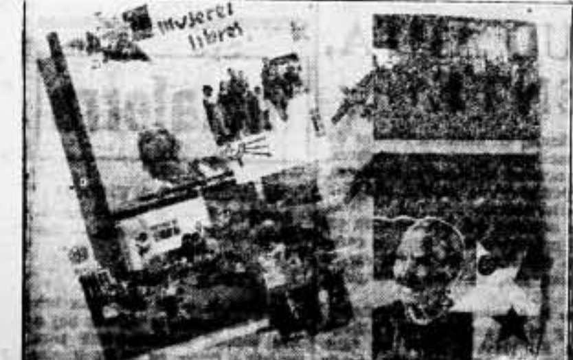
Cuatro aspectos de su actividad: maternidad, enseñanza, campo e industria