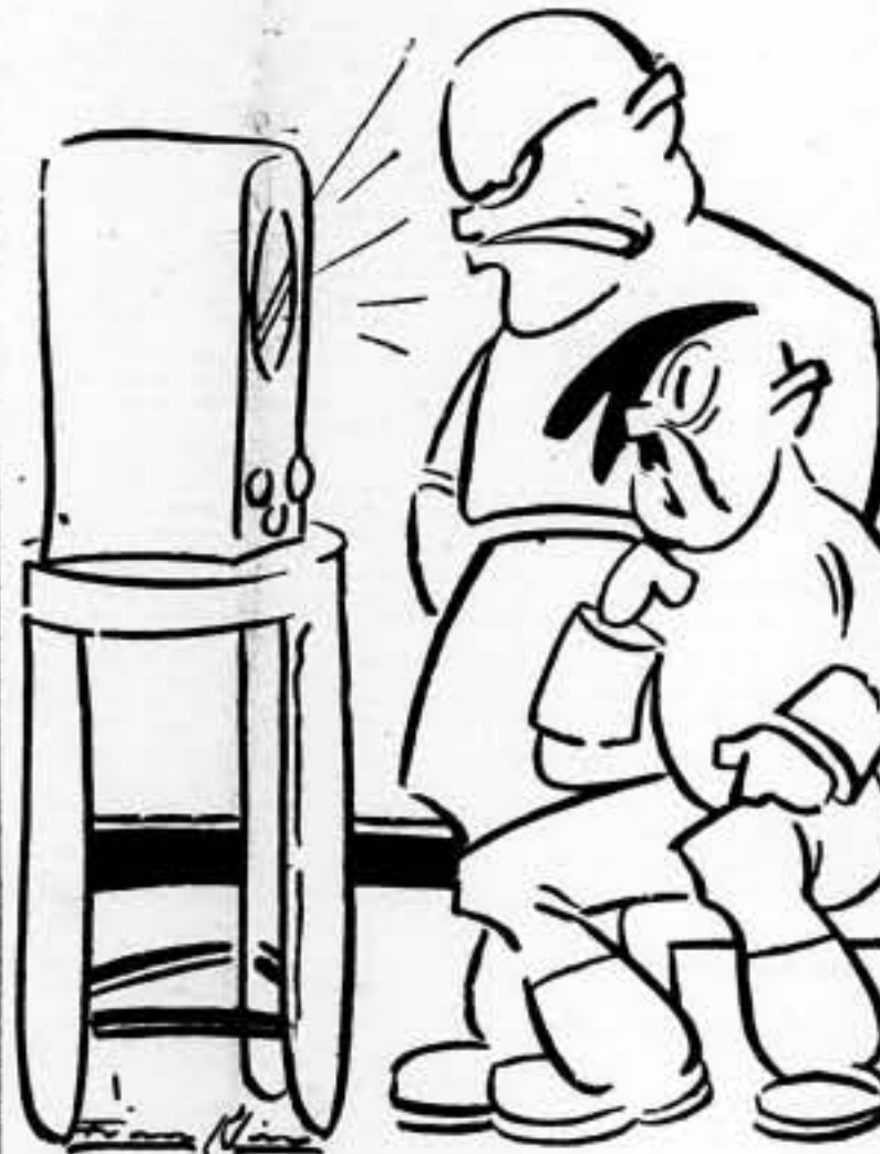
«Las tropas españolas del generalísimo...» —Oye, Benito, ¿desde cuándo somos españoles de Franco?... ¡Esto no se puede tolerar!