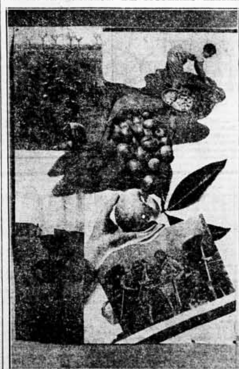
Compañeras organizadas colectivamente durante la realización de su tarea diaria.