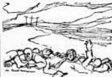
¡La tierra prometida!