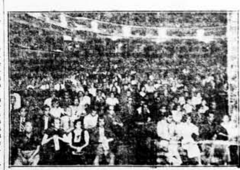
Aspecto del Teatro Tivoli, durante el festival artístico, organizado por la Escuela de Militantes de Cataluña, a beneficio de las Guarderías Infantiles, asociadas por S. I. A.