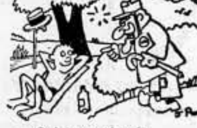
—¿Qué haces tú ahí? —Al servicio de la una inter. vención.

Mañana, lunes, se reunirá el Secretariado de esta Federación. Precisa que cada Escuela mande un delegado, pues se tratarán cuestiones que afectan a todos en general. La reunión tendrá lugar en el departamento de la Federación Local de Ateneos.