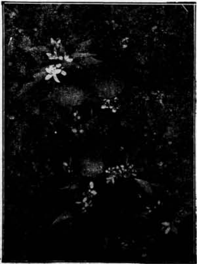
Fuente y cruce en la Ribera

lanzada por la Agencia (oficial) del Gobierno italiano, la Agencia Stefani, por medio de una información fechada en París, según la cual, el vicepresidente del Consejo, Chautemps, encargado de los asuntos de España, había tomado la decisión, de acuerdo con el embajador español en París, de permitir el paso por la frontera de los Pirineos a 8.000 voluntarios procedentes de Bélgica y de Luxemburgo; por otra parte, al Ejército francés había enviado a España 500.000 quintales de trigo.