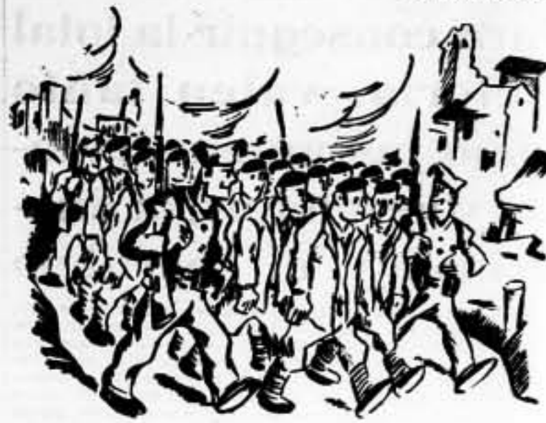
—¡Esta vez no podemos negar que ha habido una retirada en masa!