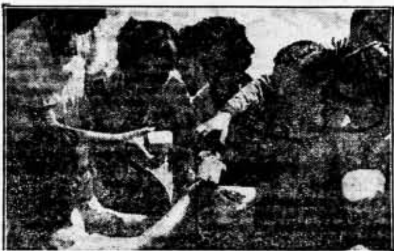
Las obreras de Industrias de Guerra visitan la Exposición de Mujeres Libres.