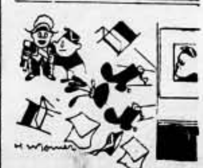
—El «Duce» está ocupado... Está poniendo los últimos toques a su próximo discurso pacífico...

No se hace ninguna profecía temeraria decir que aun en el caso en que se produjera una calamidad tal como su victoria en España, Franco, protegido por Mussolini y Hitler, se adheriría a este pacto".—Agencia España.