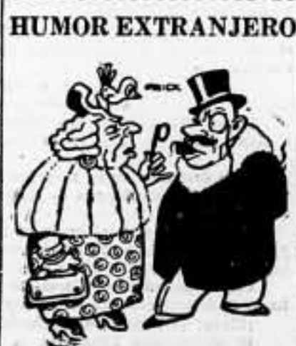
— La clase obrera se queja de los precios de los alimentos. — Siempre le mismo... se plean más que en comer... —

Roma, 6. — La "Gazzetta Ufficiale" publica un decreto-ley aprobando la adhesión de Italia a la Conferencia Internacional de Montreux, relativa al régimen de los Estrechos. El decreto tiene efectos retroactivos al 2 de mayo de 1938. — Fabra.