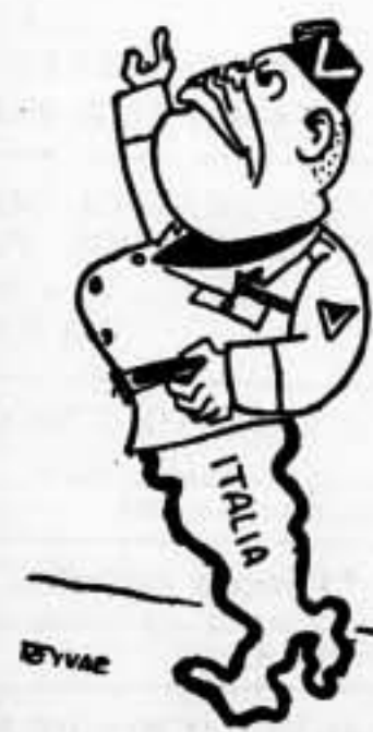
El coloso con pies de arcilla

La forma de las circunstancias ha vuelto a determinar que ayer sábado no haya podido publicarse «O N T».