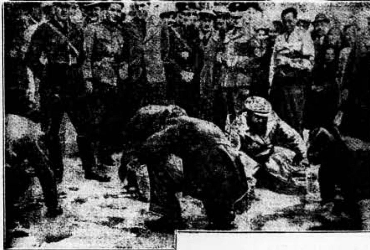
La Policía forzando a los judíos a limpiar las calles con cepillo y jabón. Algunas veces se ha impuesto hacer lo propio a las mujeres hasta con la lengua