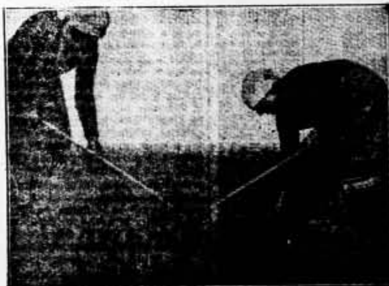
La herramienta del trabajo es tan útil como el fusil del combatiente.