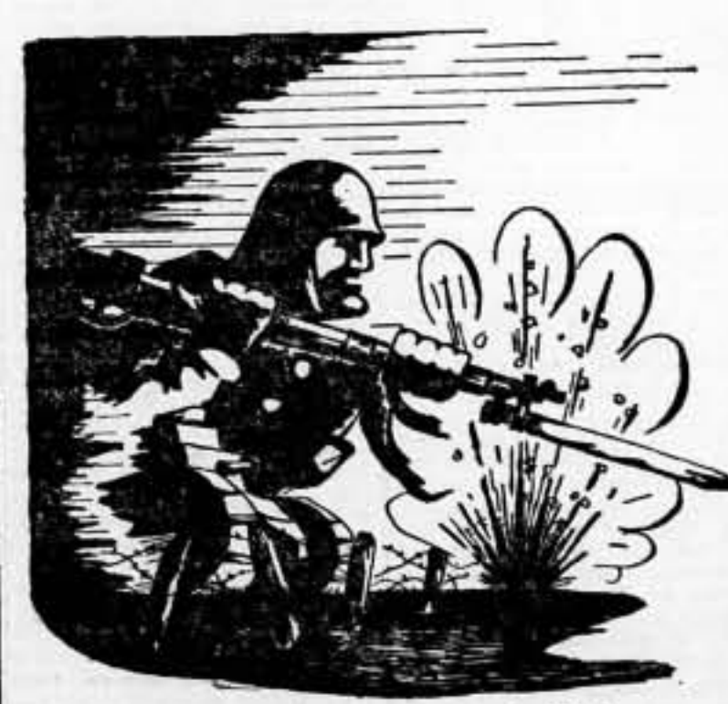
De la resistencia al ataque: hasta la victoria