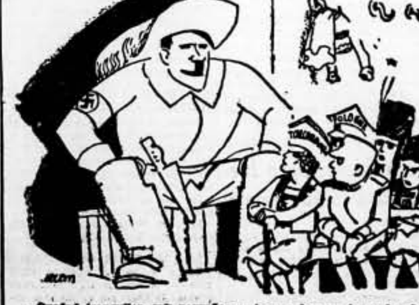
—Quédate tranquila, mi pajarito amigo... hay no tengo hambre. (De la República)