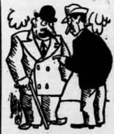
—¿Has cavilado tú sobre eso de los empréstitos? —Nunca, casualmente iba a decirte si me podría dejar algo.

La nueva Comisión Ejecutiva del Partido Socialista que ha sido nombrada en la reunión del Comité Nacional, es la siguiente: (Pasa a la página 2).