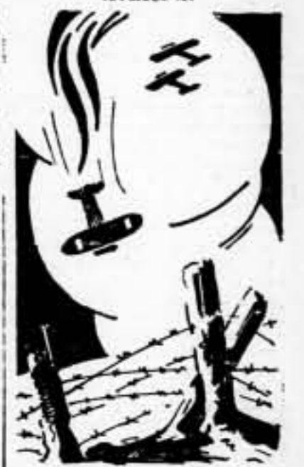
A las 10'42 horas de ayer, cinco trimotores italianos "Savoia" que volaban a gran velocidad y altura, lanzaron sobre Alicante un centenar de bombas de gran peso, que cayeron en las cercanías del hospital y barrios obreros, causando víctimas. Tres de los aviones de la invasión fueron alcanzados por el fuego de nuestros antiaéreos, cayendo uno de ellos en barrena, al mar, y alejándose los otros dos, perdiendo visiblemente velocidad y altura.

DEMAS FRENTE. — Sin noticias de interés.