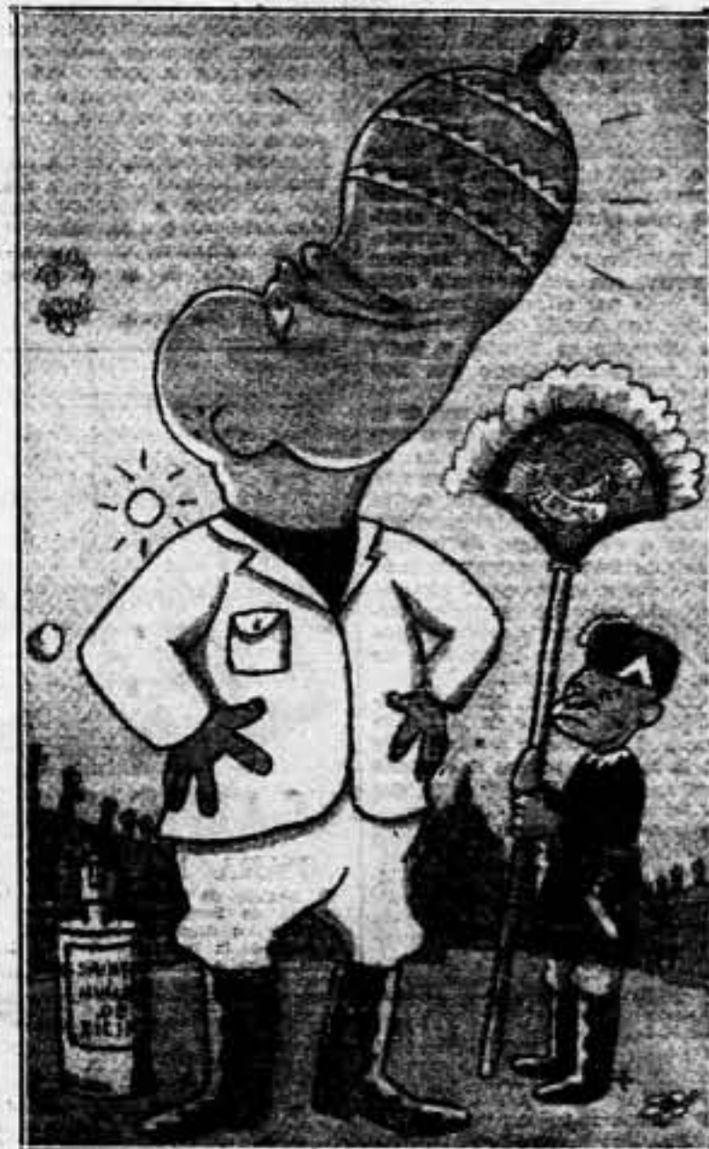
—¡Yo también soy Papa!