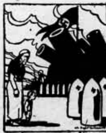
—Esos están siempre bien alimentados!