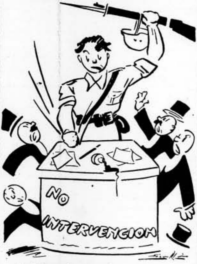
—¡Si ustedes no valen para nada, no tienen ningún derecho a obstaculizar nuestra victoria!