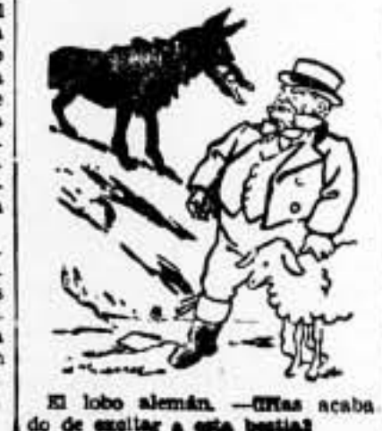
El lobo alemán. —(Elas acaba de salir a esta bestia)