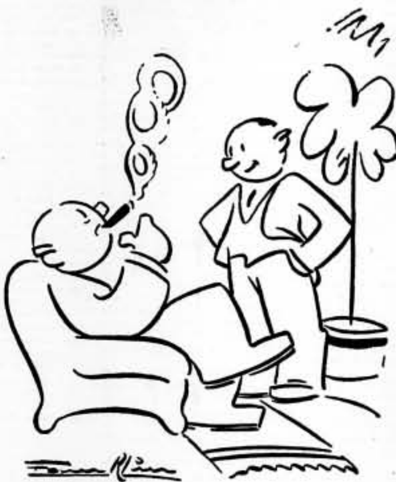
—Sí, hombre. Figúrate si estaría loco, que dió toda su fortuna sólo por un "franco"!