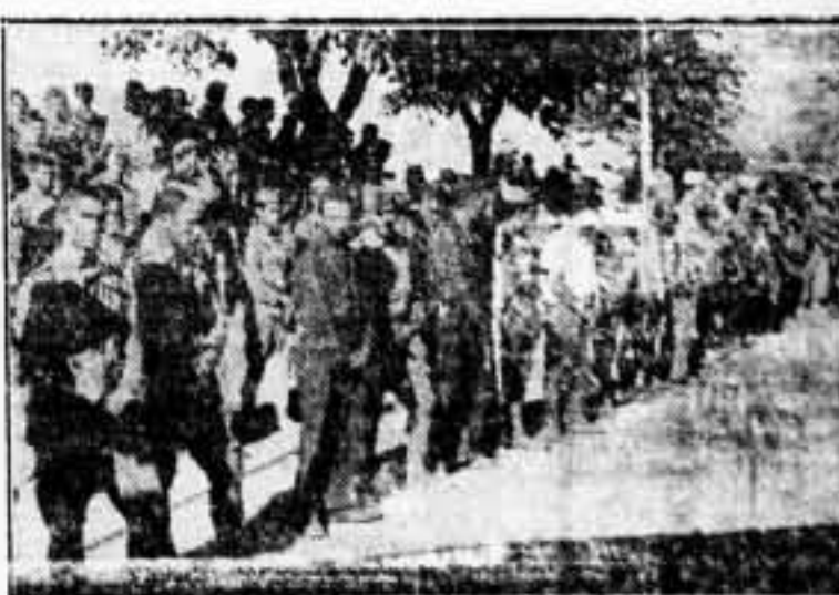
Prisioneros hechos por el Ejército Popular en las operaciones militares del Ebro

Somos hijos de la Internacional, de ese despertar formidable del proletariado; pero lo somos mucho más de la propia historia española. Y justamente por esa correspondencia entre la voz del socialismo moderno, entre las sugerencias hechas a los obreros españoles por Bakunin, a través de Giuseppe Fanelli, y la concepción legítimamente española del federalismo, de la descentralización, las ideas del socialismo y de la libertad encontraron un campo tan abonado en este país. No era nada nuevo lo que llegaba en la palabra persuasiva de Fanelli, era sólo un adobonazo para despertar lo adormecido por los siglos de despotismo centralista.