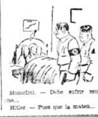
Mussolini. — Debe sufrir mucho... Hitler. — Pues que la mate...