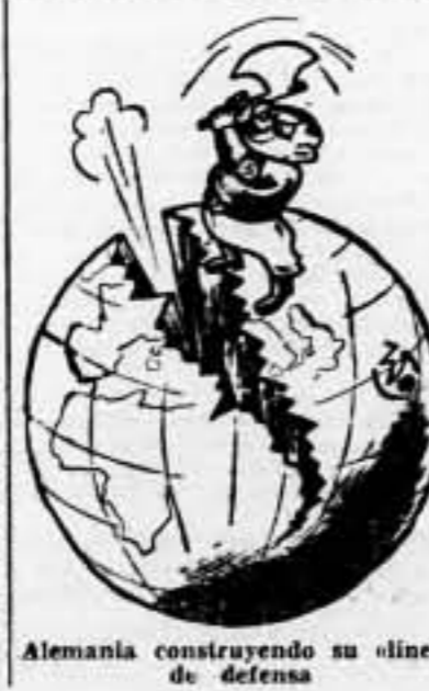
Alemania construyendo su línea de defensa

COMISIÓN JURÍDICA DE CATALUÑA Se precisa, castro albañiles, para jornal y condiciones, dirigirse a este Comité Regional, Via Durruti, 36, quinto piso.