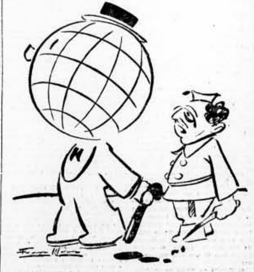
—Todo me sale mal, desde que el Mundo me ha vuelto la espalda.