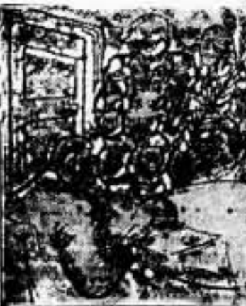
¿Cuál de los dos será llamado?