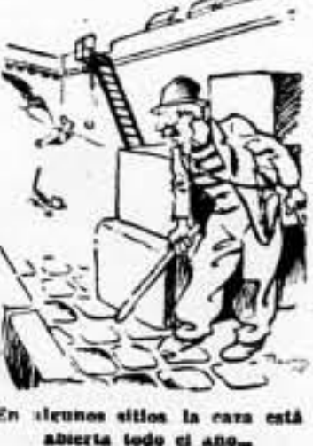
En algunos sitios la caza está abierta todo el año.

El aliento de la Libertad no se debilita en Cataluña, ni por la sangre ni por el fuego, ni bajo el yugo de las pistolas, ni por los tormentos de Montuich, ni bajo las represiones más sangrientas. Aquí ha latido siempre poderosamente, en una protesta continua, ensangrentada por las represiones llevadas a cabo por los esbirros más feroces del centralismo.