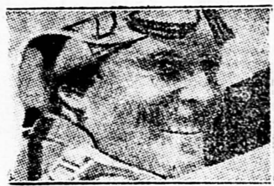
El aviador americano Roscoe Turner, que ha ganado el Trofeo Thomson, al alcanzar una velocidad media de 462 kilómetros por hora

El balance ciclista del año es una afirmación de la hegemonía mundial belga. — El de los campeonatos de Europa de Atletismo, lo es de la maravillosa densidad atlética de Finlandia. — Y un examen de lo que pasa en casa, sigue siendo, también ahora, extremadamente decepcionante