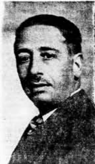
Luis Companys, Presidente de Cataluña, que dirigirá la palabra a los manifestantes, ante la estatua de Rafael de Casanova

El desfile ante el monumento por parte de los partidos políticos y entidades sindicales, culturales y patrióticas, será libre comenzando a las siete de la mañana para acabar a las ocho de la noche.