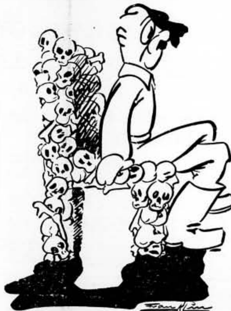
—Aunque los demás se espongan, yo intentaré hacerme un mobiliario completo.

Las operaciones se efectuarán mar adentro, unas 50 millas. — Fabra.