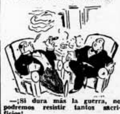
— ¡Si dura más la guerra, no podremos resistir tantos sacrificios!