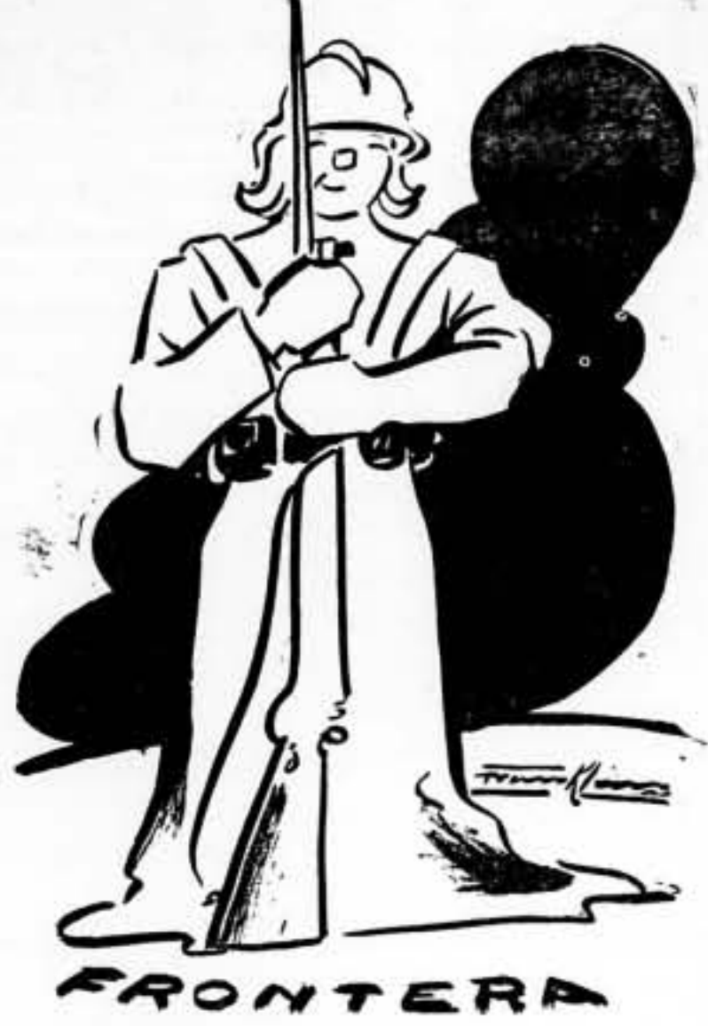
—Aqui estoy. No tengo miedo a nadie.