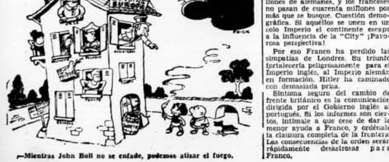
—Mientras John Bull no se enfada, podemos atizar el fuego.