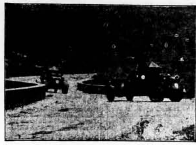
Detalle de las grandes maniobras efectuadas por el Ejército francés

«Hace más de un año y medio, en aquellos días rudisimos, cuando la política y la guerra conjugaban su silueta sombría, alcé la voz en Valencia, para recordar a todos, con la aprobación del Gobierno, que el Estado republicano sostiene la guerra porque se la hacen; que nuestros fines de Estado eran restaurar en España la paz y un régimen liberal para todos los españoles; que nosotros no soportábamos ningún despotismo, ni de un hombre, ni de un grupo, ni de un partido, ni de una clase; que los españoles somos demasiado hombres para someternos calladamente a la tiranía de la pistola o a la sinrazón de la ametralladora; que en la guerra no se ventila una cuestión de amor propio; que el triunfo de la República no podría ser el triunfo de un caudillo, ni de un partido, sino el triunfo de la Nación entera, restaurada en su soberanía y en su libertad.» (Del último discurso del Presidente de la República.)