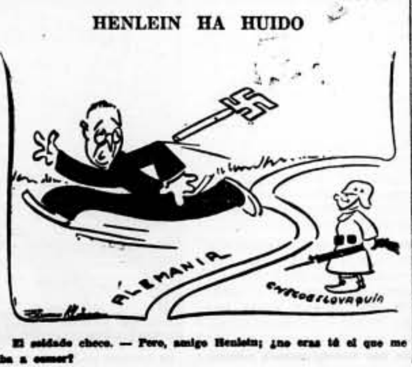
El estado checo. — Pero, amigo Henlein; ¿no era té el que me iba a comer?