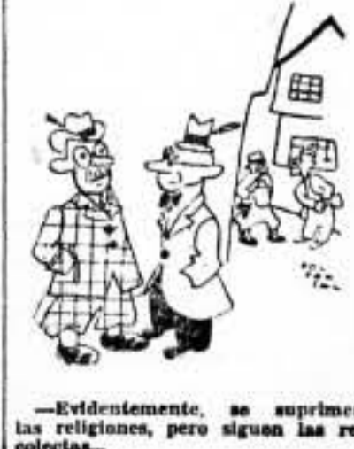
—Evidentemente, se suprimen las religiones, pero siguen las recolecciones.

París, 17.—Se anuncia que los señores Daladier y Bonnet, saldrán en avión para Londres, mañana a las ocho de la mañana, del aeródromo de Le Bourget, a bordo de un avión de la "Air France".