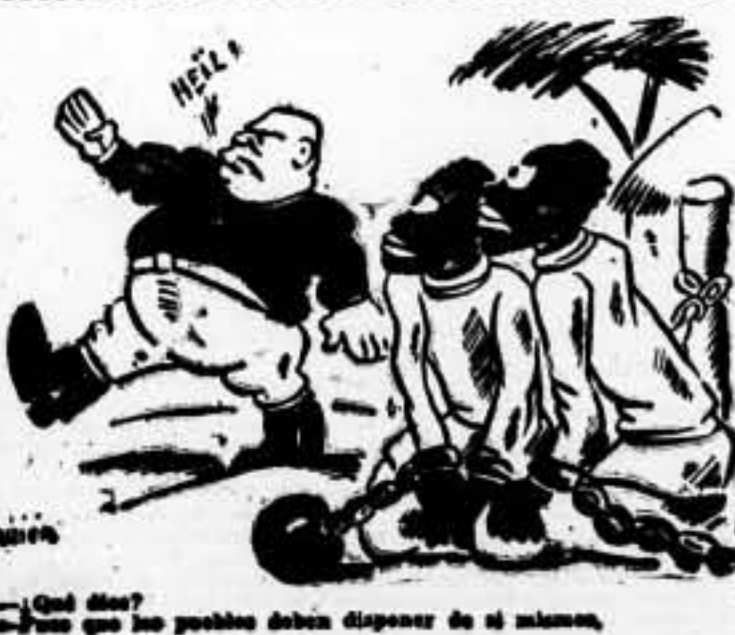
¿Qué dice? ¿Pasa que los pueblos deben disponer de sí mismos.

Bruselas, 27. — El primer ministro, Spaak, se entrevistó largamente esta mañana con el ministro de la Guerra y con los jefes de Estado Mayor. Después de la entrevista, el primer ministro y el ministro de la Guerra fueron recibidos por el rey. A continuación, el primer ministro convocó telefónicamente un Consejo de Ministros, que se reunió esta tarde y decidió adoptar nuevas precauciones militares. Ha sido publicado un comunicado en el cual se anuncia que "el Gobierno ha decidido completar las precauciones militares ya tomadas. La decisión ha sido inspirada por un deseo de seguridad y de paz." El Consejo de Ministros ha tomado otras medidas económicas. Parece que han sido llamadas banderas seis quintas. Bruselas presenta un nuevo aspecto. Se ven una gran cantidad de hombres con uniforme militar, y la capital salen camiones y automóviles militares hacia la frontera. Algunos Ayuntamientos han empezado a la distribución de caretas antiguas. La Prensa comenta la situación y especialmente el discurso de Hitler. "La Peuple", socialista, dice que, a pesar del tono, Hitler ha querido reservarse un terreno para retirarse. Los otros periódicos liberales y conservadores hacen una misma observación, diciendo que el discurso de Hitler no representa un retroceso, pero tampoco un paso adelante. — Agencia España.