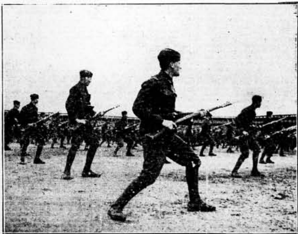
La respuesta inmediata a las bravatas de Hitler y a las provocaciones de sus agentes, ha sido la movilización general decretada por el Gobierno checoslovaqueo. En el Estado de deportes de Praga se realiza el entrenamiento de los soldados, dispuestos a detener la posible invasión nazi.