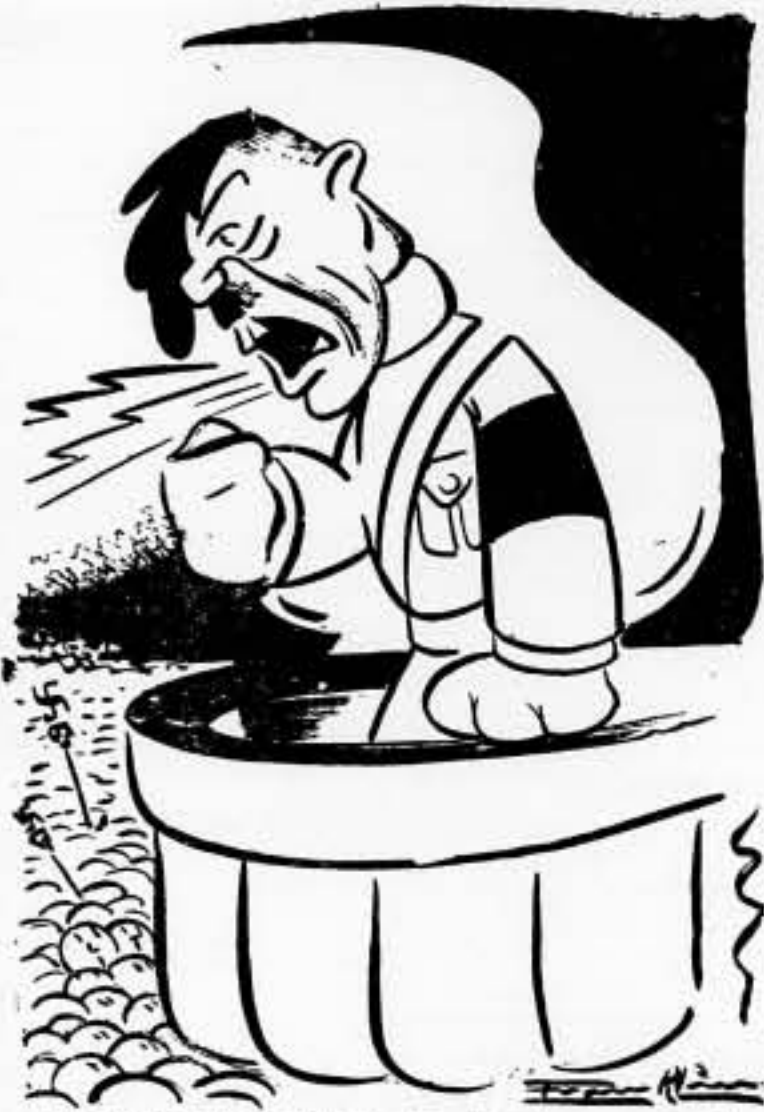
— Vosotros no queréis la luna, ¡pero lo quiero yo, y tenéis que ir a buscarla!...