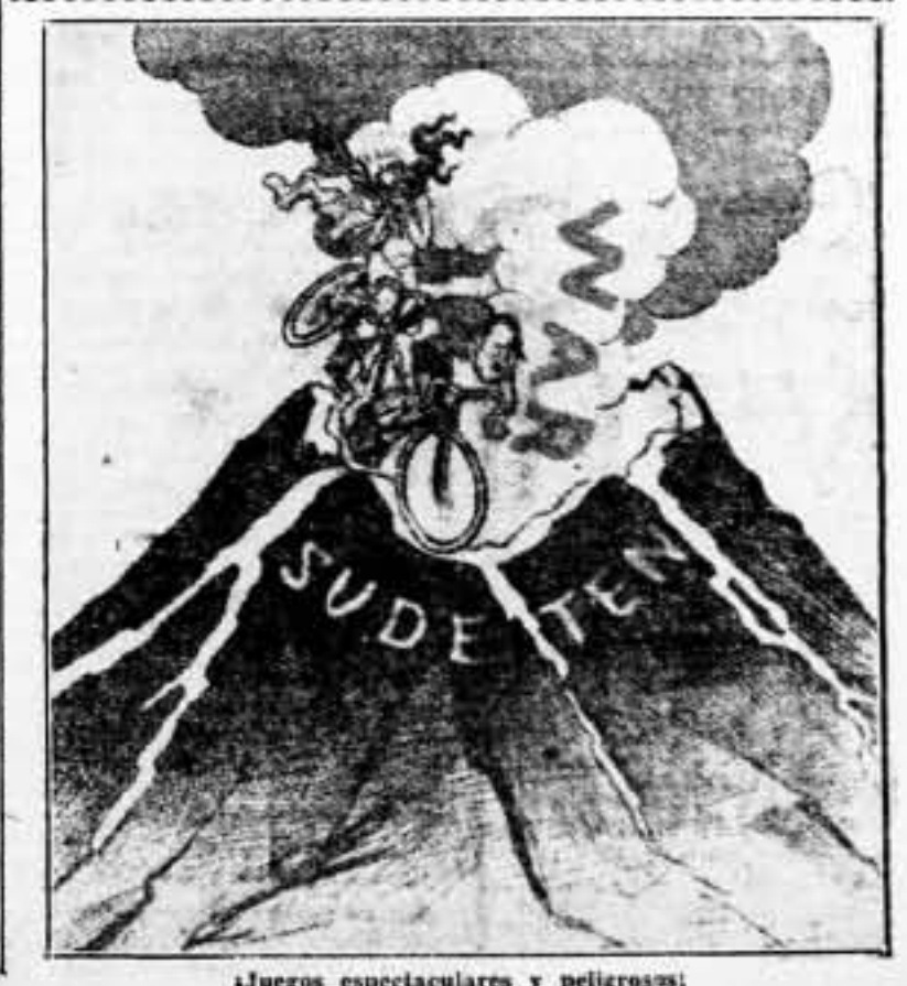
Juegos espectaculares y peligrosos.

El forcejeo de Inglaterra para salvar la situación actual, nos parece inútil. Habría de salvarse momentáneamente, sacrificando aún más a Checoslovaquia y resurgiría la tensión sin tardar mucho. El tino del documento en que Hitler responde a Roosevelt, demuestra que lo de los sudetas no es todo, ni mucho menos. Por eso alude a la bohevización checa y al peligro ruso. Sin que esto sea tampoco lo fundamental, sino un pretexto para seguir maniobrando, en alto siempre la espada desafiadora. Una espada que no se humillará nunca, si no se la abate por la fuerza, pues Hitler la empuja para ejecutar hasta el fin su plan político imperial y revisionista. Que a eso se tiende: a la revisión del Tratado de Versalles, con las consecuencias inherentes a una revisión completa y a fondo, que ponga a Alemania en posesión de lo que perdiera, más los intereses por el tiempo pasado sin disponer de lo que era suyo. «Está Chamberlain decidido a satisfacer esa deuda que, según los alemanes, se halla pendiente de pago por parte de las Potencias vencedoras el año 14? Pues si no lo está, y nos figuramos que no lo está, no pierda el tiempo resolviendo minucias — lo de los sudetas es una minucia, como lo de España — y prepárese, con sus aliados, a abahir por la fuerza la intransigencia del «Führer». Lo demás, es engañarse a sí mismo y negarse a ver lo que está más claro que la luz.