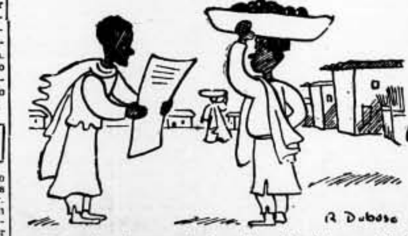
—Estos serían los momentos de pedir a Mussolini, un plebiscito a la paz.

Roma, 28. — Texto del mensaje del señor Chamberlain a Mussolini: «Hoy he dirigido un último llamamiento a Hitler para que se abstenga de hacer uso de la fuerza para resolver el problema sudeta, que estoy convencido que puede ser resuelto mediante una breve discusión que le daría todo el territorio esencial con su población, y que protegería tanto a los sudetas como a los checos durante el período de transición.»