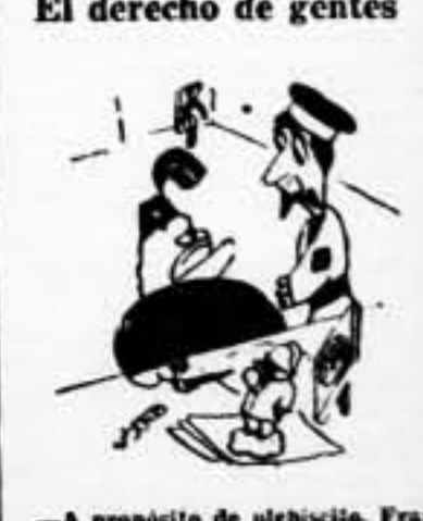
—A propósito de plebiscito, Franco pide más refuerzos.