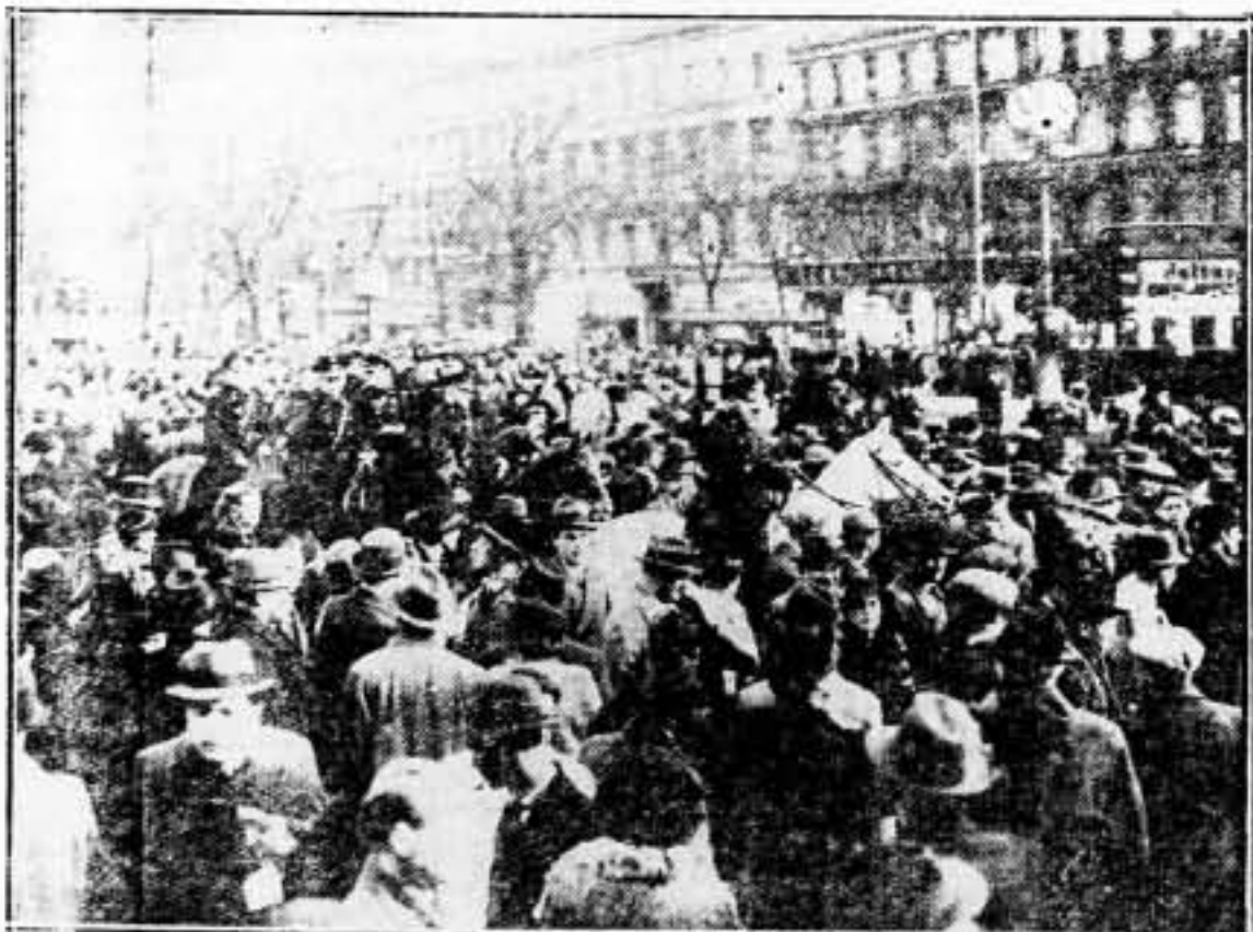
La magnífica reacción del Pueblo checoslovaco, frente a las insolentes bravatas de Hitler, es uno de los hechos que más cuentan en el desarrollo de los actuales acontecimientos europeos. Afirmando su voluntad de defenderse. Checoslovaquia ha hecho fracasar el primer plan de Hitler, consistente, sin duda, en hacer rendir a la República centro-europea, sin combate. Aparece aquí una vista parcial de la gran multitud que llenó, hace unos días, la amplia plaza de San Wenceslao, en Praga, reclamando la defensa a todo trance, contra la amenaza hitlerista.

París, 28. — Mañana en Munich, a mediodía, se entrevistarán los señores Daladier, Chamberlain, Mussolini y Hitler. — Aima.