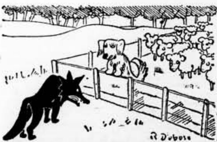
—Tú, lobo, ¿qué quieres aquí? —Quiero impedir que los rejos se metan en tu rebaño.