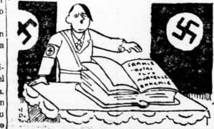
Juro sobre el Mein Kampf, que no tenemos ni un odio contra las otras naciones.

Brigada Prats, 5 y 7 (Gracia), y Cortes, 491