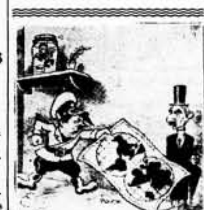
—¡Ahí tienes mi tarjeta!

Toscanini reside actualmente en Milán, y se declara que su libertad de acción personal no se ha visto menudada. — Fabra.