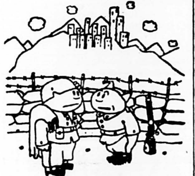
—Parece que ahora se ocuparán de España... —Muy bien, aquí estamos preparados...»

ta definitivamente destruida. Contesté afirmativamente, y no lo lamenté. Habría preferido que todas las Potencias interesadas hubiesen podido estar presentes, pero era preciso actuar muy rápidamente, porque la menor dilación podía ser fatal. Una conversación franca con Hitler y Mussolini, ¿no era mejor que todas las proposiciones en todas las discusiones escritas? Ya conocen ustedes el resultado de la entrevista de Munich, que fué más bien una conversación útil que una conferencia formal. Evitamos que se recurriera a la fuerza. Provocamos, sin que pueda ser admitida duda alguna, sobre el particular, el plebiscito de la paz en los cuatro países. Por entusiasmo espontáneo que se reservó en Berlín, en Roma, en Londres y en París, por partes de los Pueblos de estas naciones a los cuatro jefes de Gobierno, por los innumerables testimonios que llegan a unos y otros,