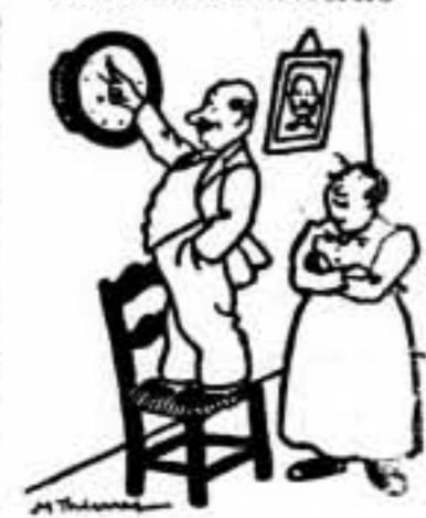
«¿No ves, hombre? Hasta la hora se está normalizando...»