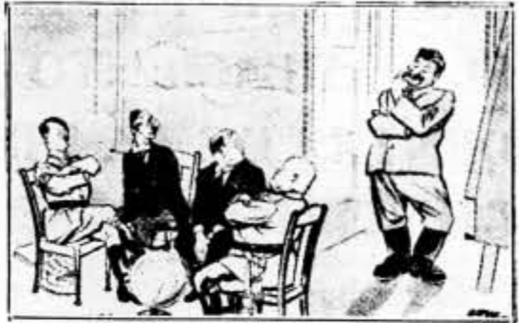
«Como, no hay silla para mí?»