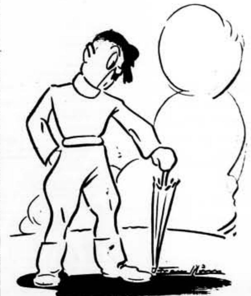
Hitler.—¿May que ver?... ¡Le debo la vida a un paraguas!»