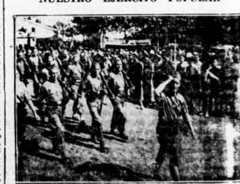
Las nuevas reclutas de los reemplazos de 1934, desfilando ante las autoridades en la fiesta dedicada a homenajarlas.