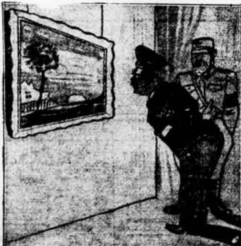
¿Quién se ha atrevido a pintar de orojo una puesta de sol? ¡Hay que oscurecerla inmediatamente!