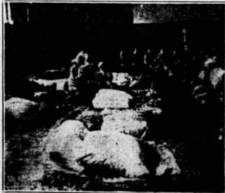
Refugiados checos huyendo del nazismo alemán