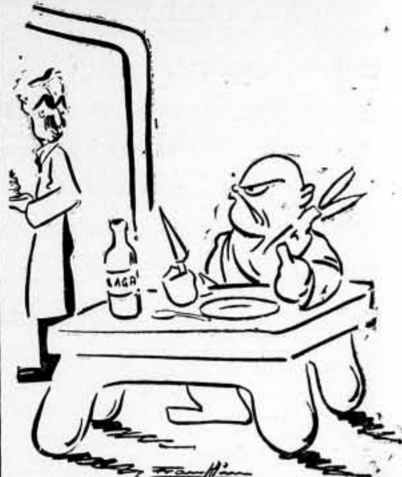
—Este cliente es menos exigente. Pues, voy a darle un pastelito, para que se entretenga...

Se celebra organizado por conmemoración expresión de latinoamericanos hoy, para ción, al margen colario o de partidista. Se los festejos de acercamiento trata realmen ción de inter grupos. El Di a muchas cel que se ha heo noamericanist dadera relación países sudamun fiesta nacional homenaje a l considera gen elementos con la participan vivas", o sea, dos en aquellos hacen poco ho y creador del Dejando a vencionales. nuestra simpa blos iberoame sa solidaridad sa de España como en esos y españoles han rebeldía y de tan vasta y p lucha contra las trabas de Gobiernos olig han manifesta pulares de sim blicana y ant daderas batal los envenenad desde los órg tas por excel ambiente en d ores al Pue esas campañ de estruendo emisarios de