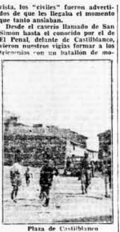
Plaza de Castilblanco

Delos detalles de esta información a un oficial enemigo, que rayó prisionero nuestro en el pasado combate de la explanada del Guadalupejo, de este frente extremeño.