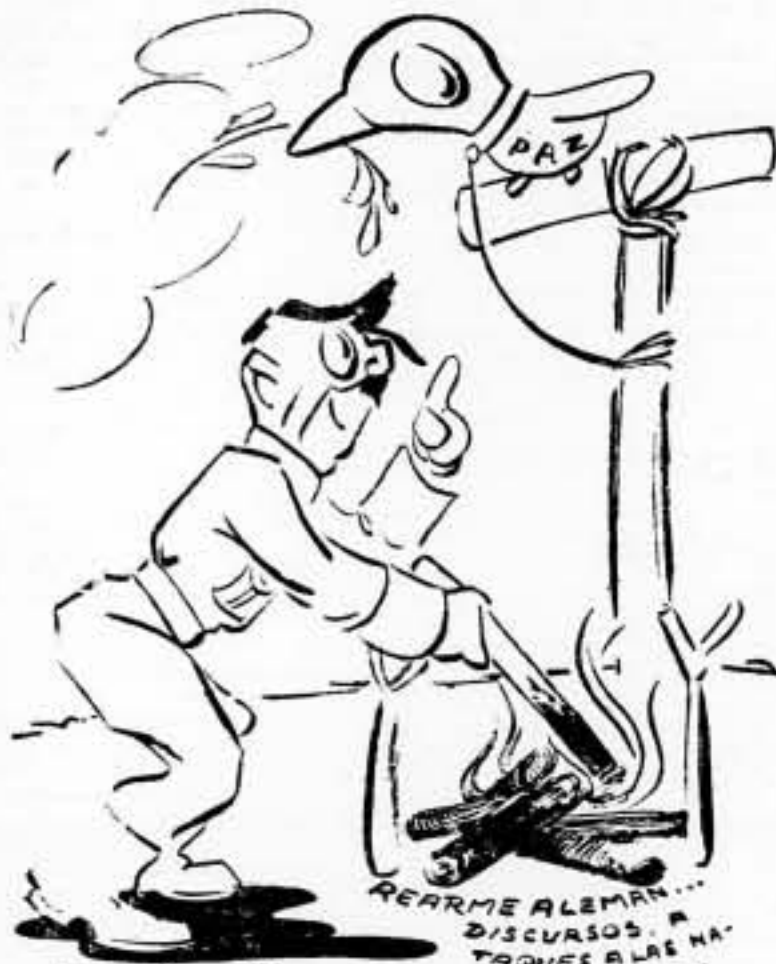
—Ya verás lo bien que estarás en el asador.