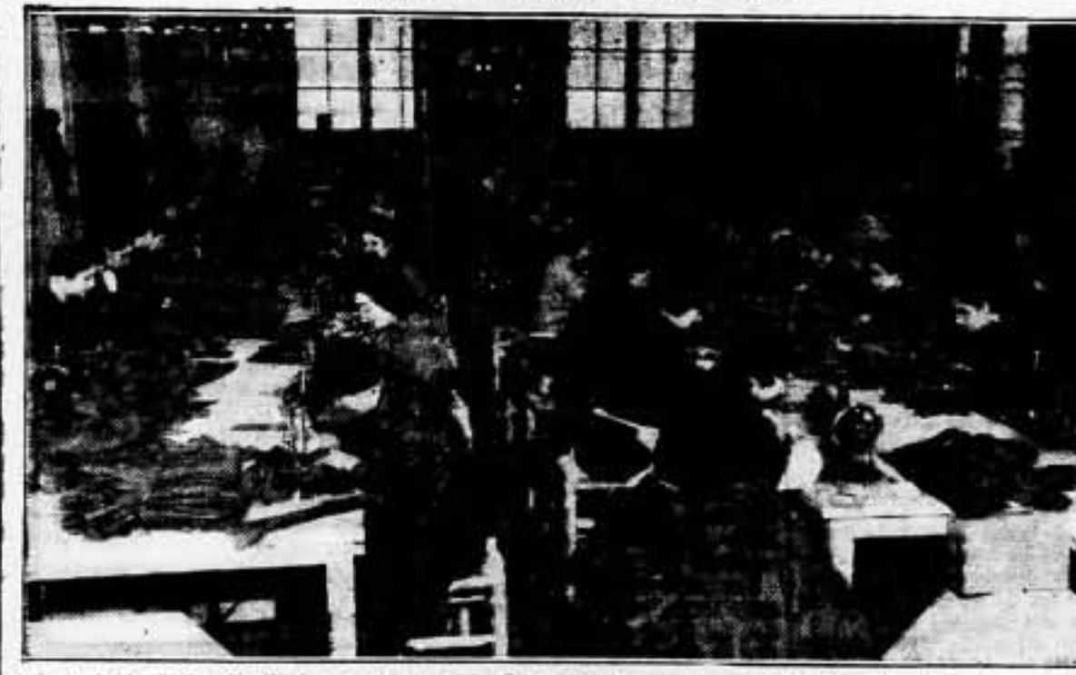
Bajo la égida de los Sindicatos, nuestras compañeras, por las gran aportación han hecho a la causa antifascista, laboran intensamente para proporcionar a los combatientes, las prendas de abrigo que necesitan para la próxima campaña de invierno