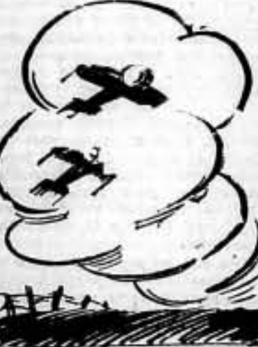
A las siete horas de hoy, nuestros cazas ahuyentaron y persiguieron a un aparato alemán "Heinkel-59", que intentaba agredir Cartagena.

Tanager, 15. — Esta mañana han llegado a este puerto varias unidades de la Flota alemana de guerra. Es la primera vez que la escuadra alemana visita el puerto de Tanager desde la terminación de la Guerra Europea. — Fabra.