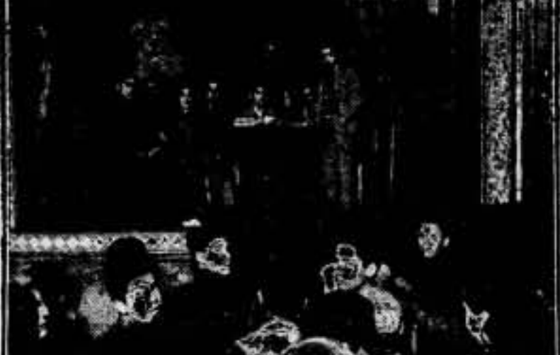
Los compañeros de las Juventudes Libertarias de Madrid Socialistas, da no cesan en sus constantes actividades de superación intelectual y de propaganda férrea...