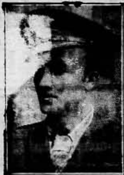
Hero libertario mejicano, Práxedes Guerrero: "Vivir para ser libres, o morir para dejar de ser esclavos".

Una vez más nos da la primera noticia: ha muerto Florentino G. Prendes. No hay en ella acentos lastimeros, sino promesas de foga y orgullo altivo, macho. Nuestros combatientes no tienen lágrimas para llorar a los caídos.