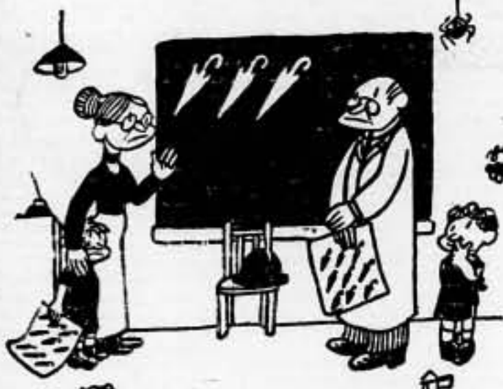
-Es en honor del padriador... En lugar de bastones, les hago llenar páginas de parágrafos...