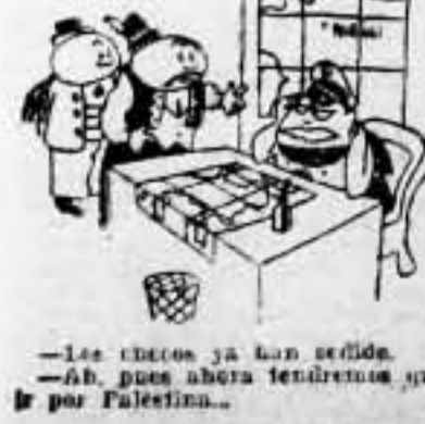
—Los judíos ya son servidos. —Ah, pues ahora tendremos que ir por Palestina.

Berlin, 17.—Una Delegación de la minoría danesa del Slesvig alemán, ha entregado hoy a Hitler una protesta por el trato de desfavor de que está siendo víctima por parte de las autoridades nacionalsocialistas, en materia de asistencia social. Los delegados han pedido, además, que Hitler les reciba en otra ocasión, para exponerle, en detalle, que los principios del respeto a las minorías, proclamado por él tantas veces, no son observados en lo que se refiere al trato que se da a la minoría danesa.—Fabra.