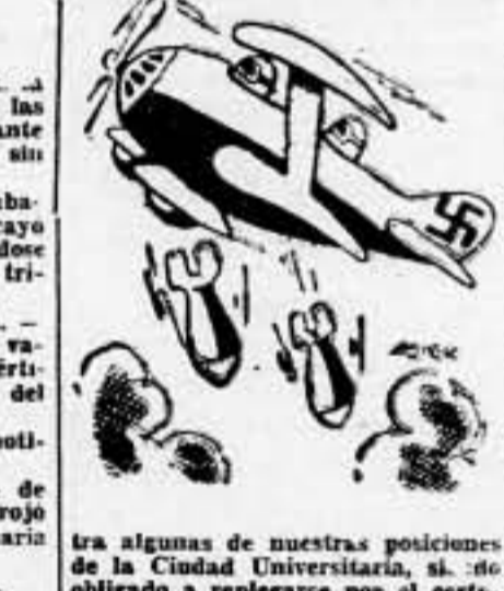
En algunas de nuestras posiciones de la Ciudad Universitaria, se vio obligado a replegarse por el cierto fuego de las tropas españolas, que le causaron muchas bajas.

AVIACION Como se consignaba en el parte anterior ayer fué abatido en este frente un "Heinkel III", que bombardeaba nuestras posiciones. El aparato tripulado por un jefe alemán de escuadrilla, fué alcanzado de lleno por un obús anticárnico, completando en el aire. Otro avión de la misma escuadrilla, tipo y nacionalidad, fué asimismo derribado, cayendo ambos en nuestras líneas. De sus seis tripulantes, todos alemanes, cuatro fueron cogidos muertos y los otros dos gravemente heridos, habiendo sido hospitalizados. DE ANOCHE EJERCITO DE TIERRA FRENTE DEL CENTRO.—Durante la noche última el enemigo realizó varios golpes de mano con-