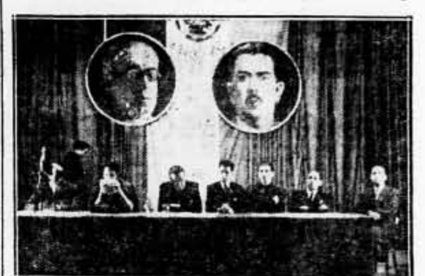
MESA PRESIDENCIAL DEL ACTO