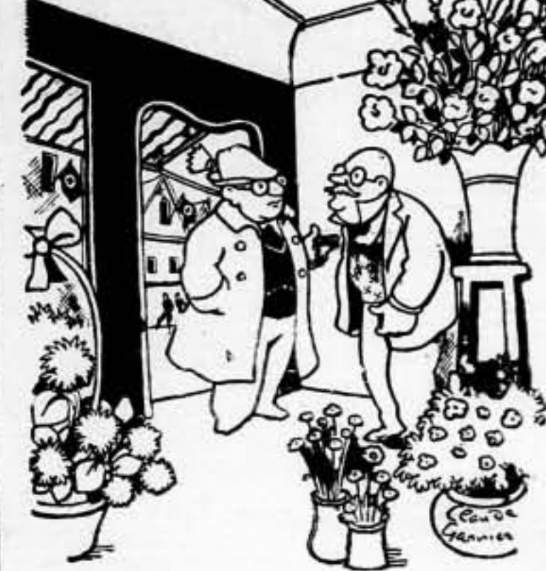
—¡Póngame usted seis quiles de dalias, tres libras de claveles y cuatro quiles de crisantemos gigantes!