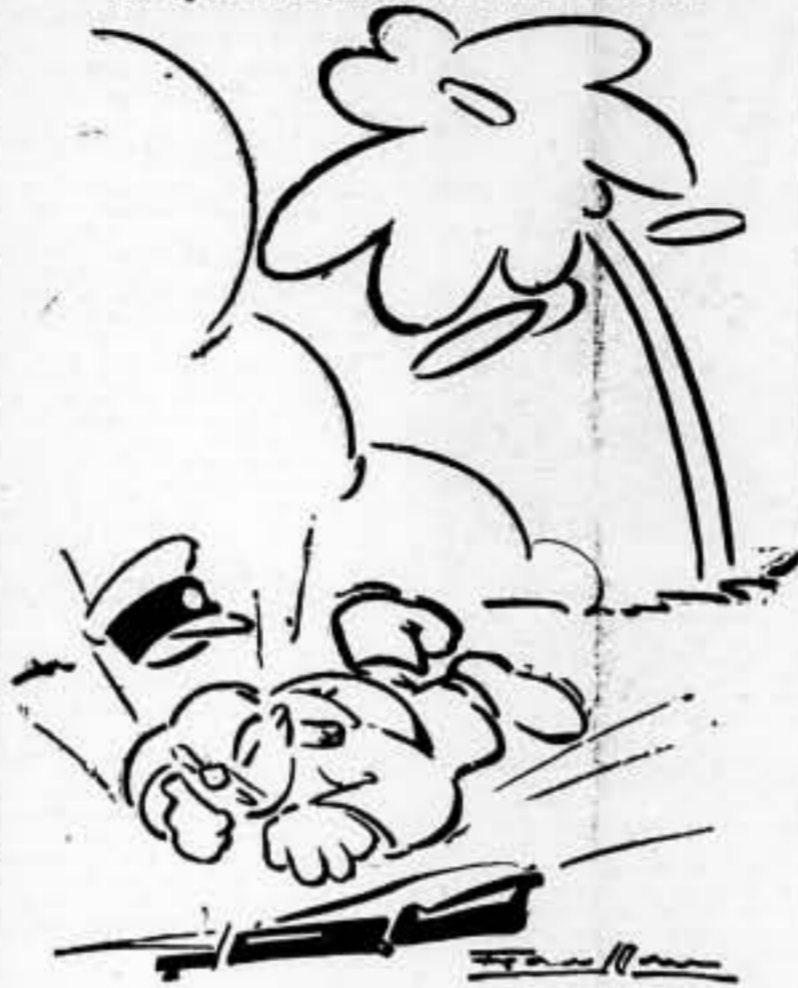
—Ya no puedo más!... Mr. Chamberlain, quiere ayudarme con una fórmula de las suyas?