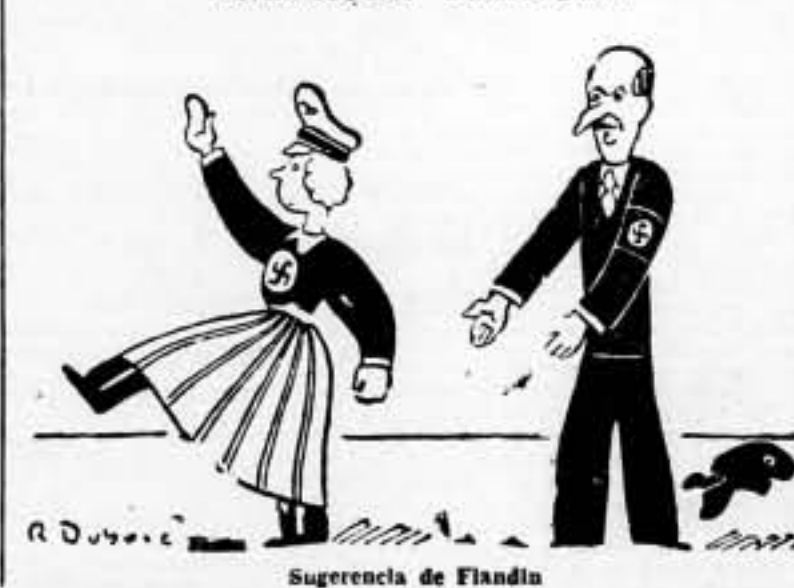
Sugerencia de Flandia