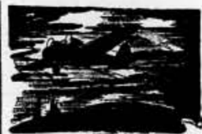
Cartagena despegaron nuestros cazas, que frustraron el propósito, persiguiendo a los aparatos alemanes hasta más de 100 kilómetros de la costa, donde el jefe de la escuadrilla alemana se vió obligado a amarrar, visiblemente tocado su avión, siendo nuevamente ametrallado por los cazas españoles que regresaron a su base sin novedad.

A las 6:30 horas de hoy, ante la presencia de cuatro "Heinkel 59" que intentaban bombardear