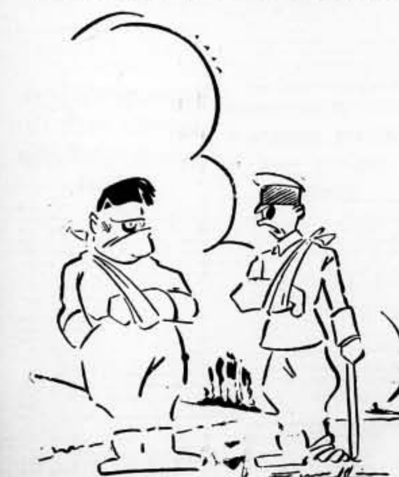
—El error es nuestro. Nos fijamos en la riqueza de estas tierras, pero no en el Pueblo que pudiera defenderlas.