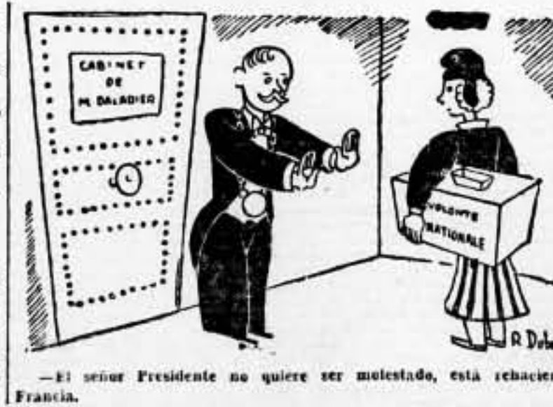
— El señor Presidente no quiere ser molestado, está rechazando Francia.