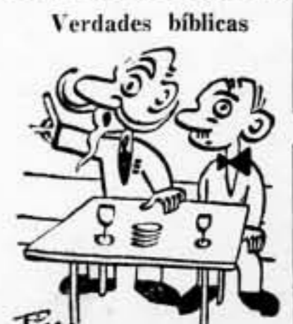
— Ah! señores, el creador puso comilón al tigre para que devorara a los corderos.

La Policía ha rechazado la agresión y ha producido víctimas, entre los atacantes. — Fabra.