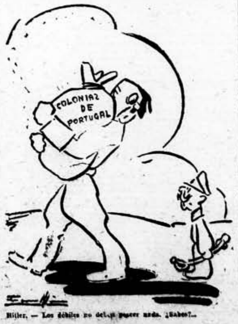
Hitler. — Los débiles no del que poder nada. ¡Sabes?