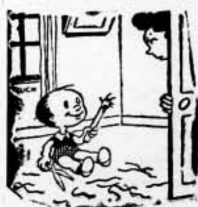
—Comprendes, mamá, soy partidario del desarme integral.