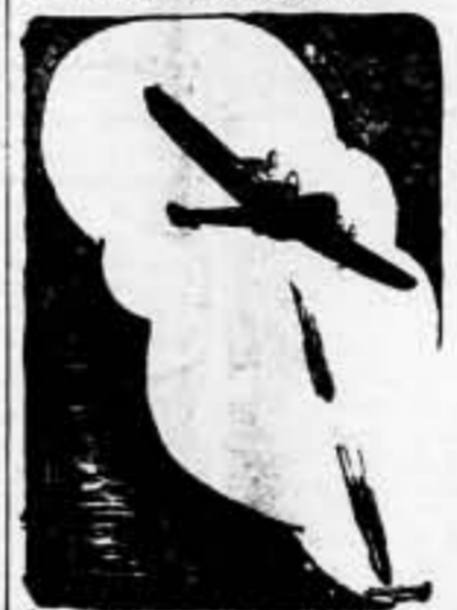
A las 8'40 horas de hoy, dos hidroaviones alemanes "Heinkel 59", que intentaban bombardear Cartagena, fueron puestos en fuga por los cazas republicanos.

Durante la noche última, los aparatos de la aviación bombardearon diversos lugares de la costa de Cataluña, ametrallando las calles de algunos pueblos.