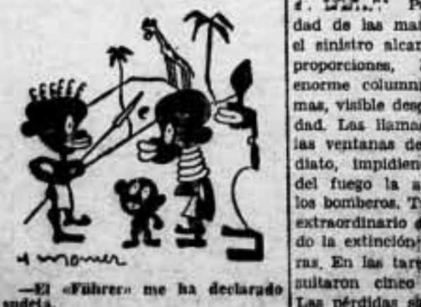
—El «Führer» me ha declarado sujeta.