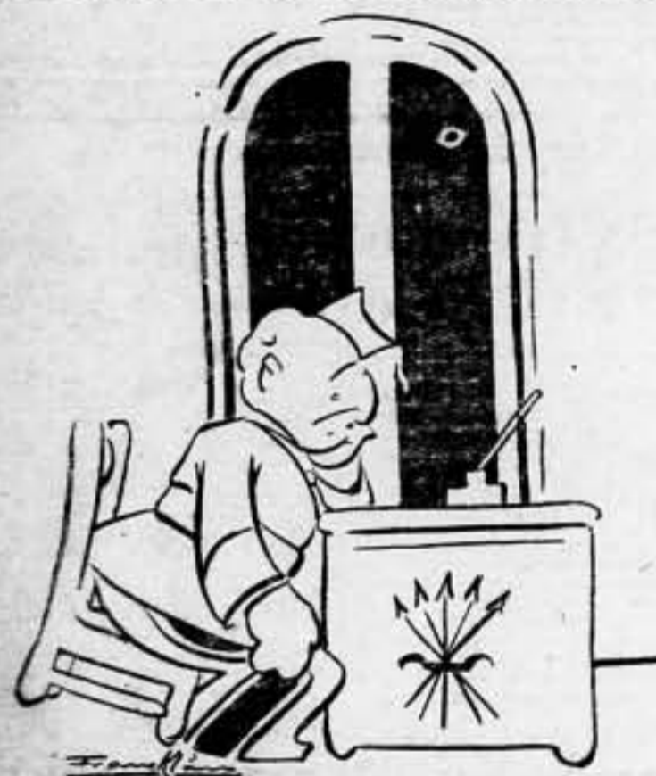
—Dice «Finto» derribados. Al fin y al cabo, Mussolini es el que girde.

Pues esa fortaleza de que damos prueba, día tras día, y por la cual alcanzamos la decisiva victoria, es la consecuencia de esa actitud permanente de la conciencia revolucionaria, que el anarcosindicalismo mantuvo durante tantos años y que es su deber seguir manteniendo entre las masas trabajadoras de la República.