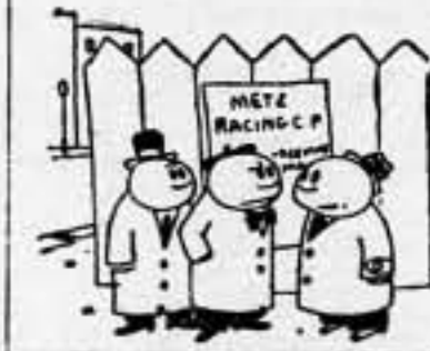
—Parece que Chamberlain tiene un plan de apaciguamiento europeo. En ese caso, ¿qué pasa, que necesita del rearme?

Marsella, 2.—A las primeras horas de la madrugada de hoy han sido retirados otros cuatro cadáveres de los descombros de las «Nouvelles Galeries».—Fabra.