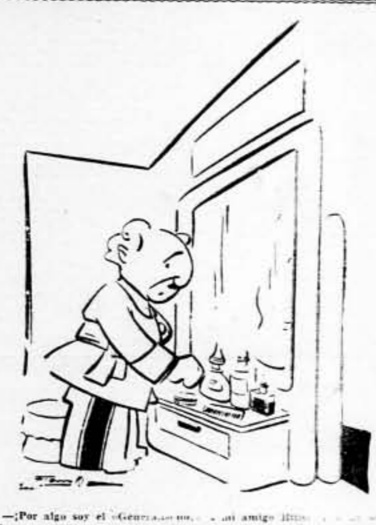
—¡Por algo soy el "Granite"... mi amigo tiene... el... vidor, nos gustan las colonias.