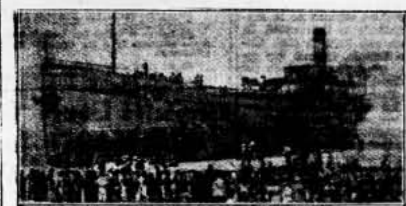
El barco gubernamental "Castalia", que ha sido atacado por un crucero rebelde en las costas de Inglaterra, yendo en lastre a un puerto inglés.

Según Pertinax, Chamberlain invitará a Francia a aprobar la política del Gobierno inglés. Pertinax dice que Chamberlain ha aceptado el predomnio geográfico del Imperio alemán en la Europa Central y ha concedido también a Alemania la renuncia a rearmarse. "Lord Halifax ha dejado caer una frase que es muy elocuente a propósito del alcance del acuerdo con Italia. Después de haber dicho, como Chamberlain, que Mussolini había dado garantías de no enviar nuevas tropas y nuevos pilotos a España y que no tenía ambiciones territoriales, Lord Halifax ha dicho que Mussolini no quiere tolerar una solución que no sea el triunfo de Franco. Lo que significa que Mussolini no observa la no intervención". Pertinax dice que estos problemas tendrán que ser examinados muy atentamente durante la visita de los ministros ingleses a París.