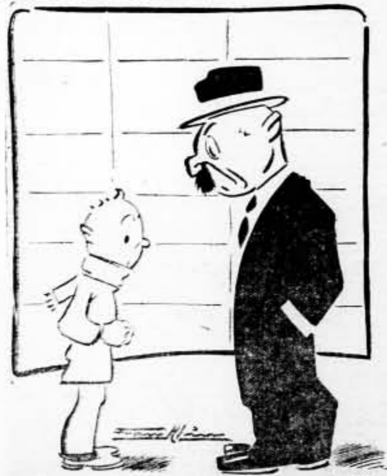
— ¡Te lo diré a la escuela si que irás... pero ha de ser cuando Hitler y Chamberlain terminen de arreglar la Geografía.

Uno de los hechos más interesantes que demuestra la experiencia de este nuevo sistema de producción, es que la mayor parte de los pequeños propietarios comprendieron sus ventajas y suscribe con buen grado la solicitud de colectivización legal, al igual que los obreros. El buen sentido, la demostración del ejemplo, privó en muchos casos sobre prejuicios de lejano arraigo. El antiguo patrono encontraba un lugar de trabajo junto a sus subordinados de la víspera, que lo trataban como un camarada más, cuyos conocimientos técnicos y capacidad administrativa eran debidamente apreciados. Se encontraba así más a gusto que cargando con la responsabilidad exclusiva de una pequeña empresa que, dadas las nuevas condiciones económicas, debía desarrollarse penosamente. La colectivización representó, pues, una solución tanto para los grandes núcleos del proletariado, como también para muchos sectores de la pequeña burguesía, particularmente para la pequeña burguesía industrial. La campaña sería pero de gran oposición al nuevo sistema que se inició a poco de aplicarse éste, fué dirigida por virulentas corrientes reaccionarias y por gente que alentaba esa campaña con propósitos políticos poco confesables. Lo que no impidió que el sistema de las Colectivizaciones arraigara honramente en la vida económica de Cataluña — como también en otras regiones de la España leal — llegando a ser la base más sólida de nuestra resistencia en el terreno de la producción.