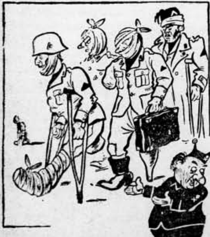
France, efectuando la retirada voluntaria de sus soldados.