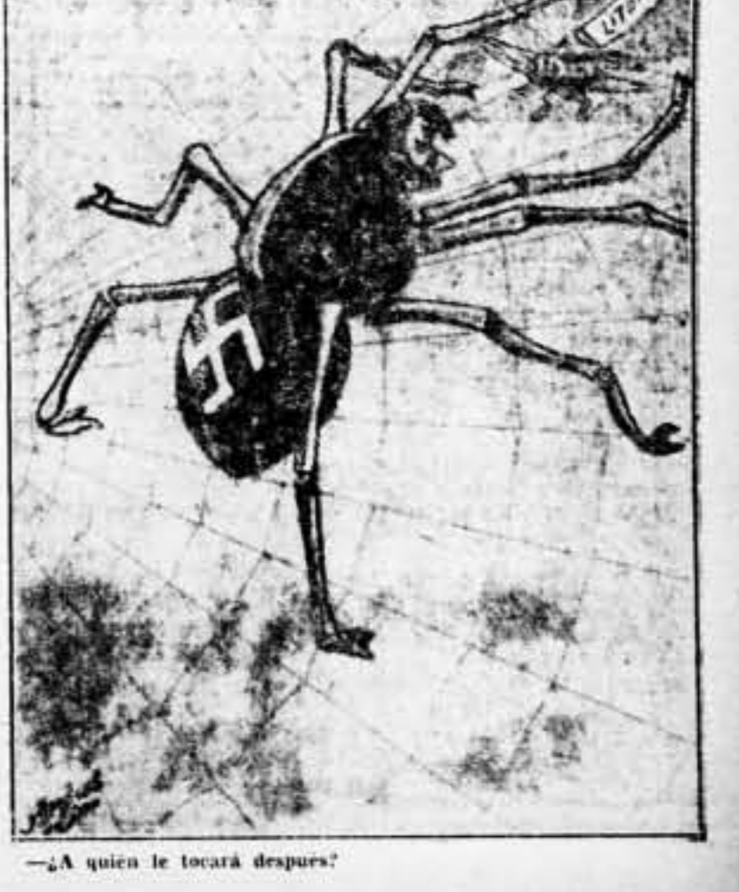
—¿A quien le tocará después?

ENSA A TEATRO CEO OFICIAL MILICO GEMAS TURINA SOL SPANIA OS