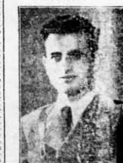
Mayor MANUEL NOYA TOBARÉS