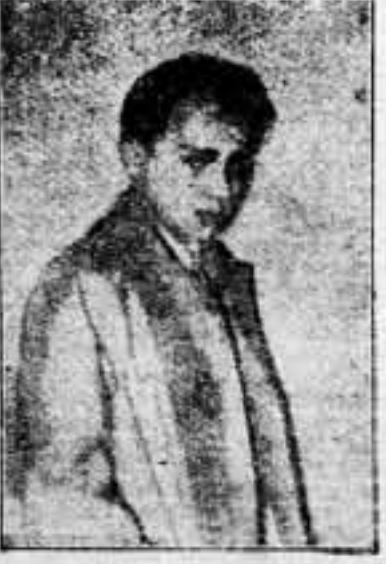
El joven judío Grynspan, cuyo gesto desesperado y valiente constituyó un simbólico acto de protesta contra la barbarie nazista.