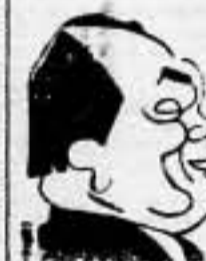
En la próxima semana podrá saberse de una manera definitiva, si perdura o se ha disuelto la situación difícil que vive el Gabinete, en la actualidad.