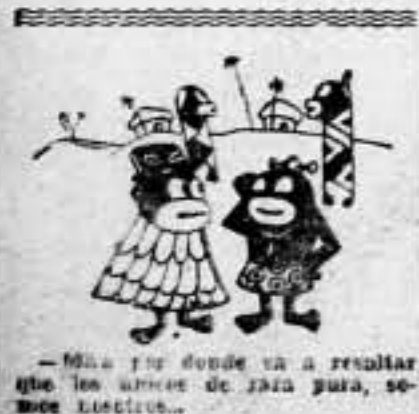
—Mira ya donde va a resultar que los aviones de jazz para, se me caen...