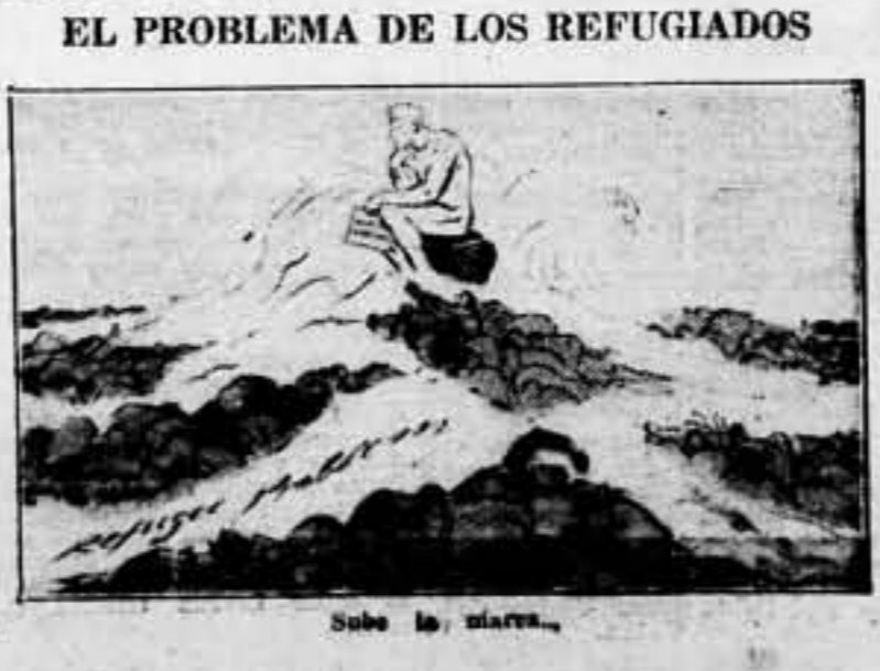
Sube la marea...

Cerbère, 12. — A la una y media de la tarde, ha llegado procedente de España el primer tren conduciendo 800 voluntarios movilizados por el Gobierno de la República española. En el momento de entrar en aguijas el convoy, es saludado con grandes aclamaciones. Una banda de música y una "cobla" catalana, han interpretado el himno nacional español y "La Internacional", himnos que han sido coreados por la gran multitud que se había congregado en espera de los expedicionarios.