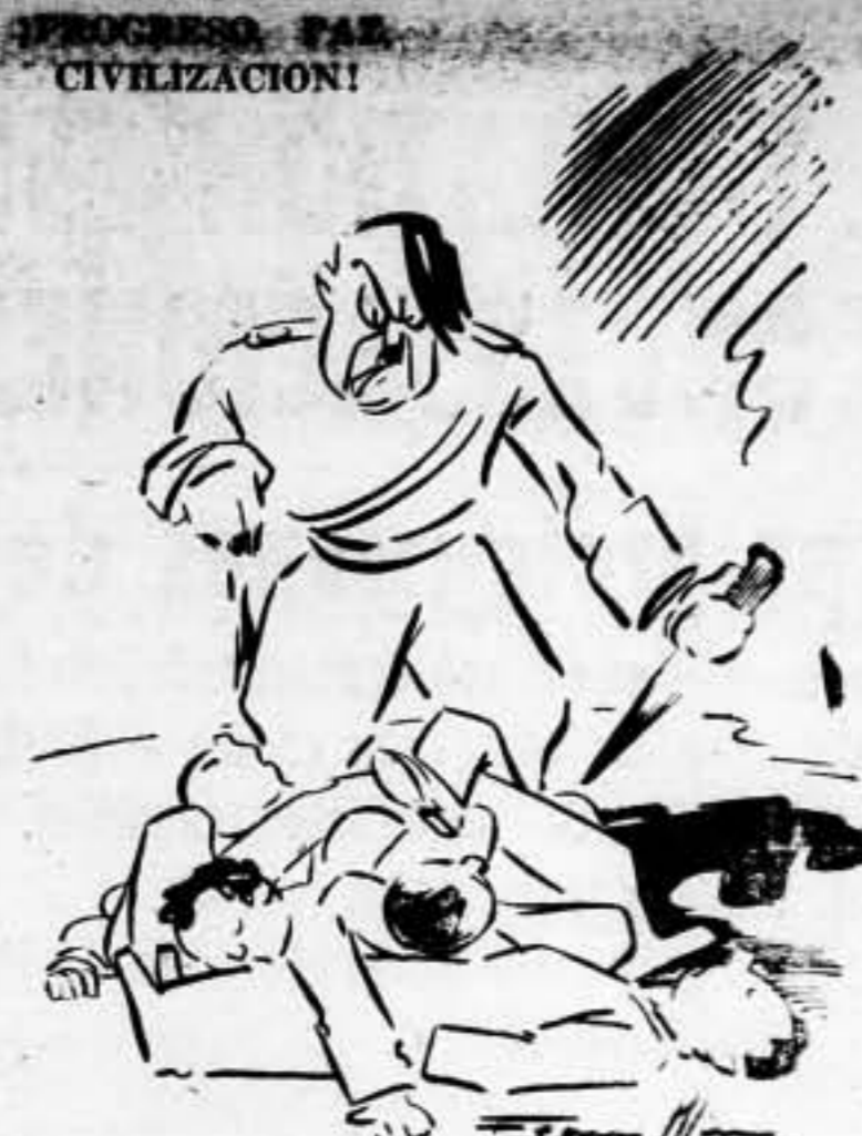
—¡Son Judíos! ¡No tienen derecho a la vida!—