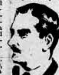
El discurso de Eden fué la exposición de un programa político que tendrá próximas consecuencias.

París, 12. — Los periódicos acentúan muy favorablemente la intervención del señor Eden, ayer en la Cámara de los Comunes. Pöbers, escribe desde Londres a «Le Jour-Echo» de París: «El discurso de Eden está llamado a tener una gran repercusión. En los círculos conservadores se le atribuye más importancia, dada la inminencia de las elecciones generales que no es negada por nadie». En cuanto a los objetivos perseguidos por el señor Eden, Pöbers estima que aquél intenta suscitar un movimiento de Unión Nacional alrededor del Partido Conservador. Propone a los conservadores un programa muy simple, pero lleno de dinamismo: rearme, progreso social, retiro de los lazos con los Dominios, los Estados Unidos y Francia. «Democrito», desde Londres, le escribe a «Le Figaro»: «El discurso de Eden señala el resurgimiento del Partido Conservador, resurgimiento que ha de conducir, ya sea a la ampliación del actual Gabinete, ya sea a unas elecciones generales próximas, tal vez antes de fin de enero, pero su efecto es "hacer sentir" ya desde ahora por el control más directo de los miembros del gran Partido de la mayoría sobre la política exterior del Gobierno actual.» — Fabra.