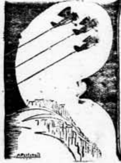
FRENTE DE LEVANTE.—Han sido enérgicamente rechazados...