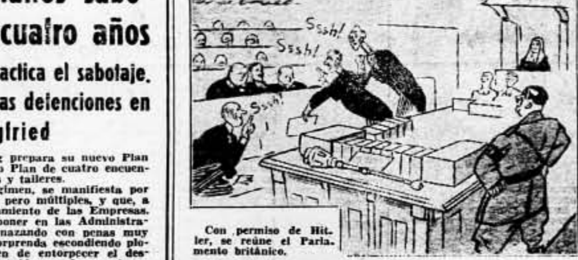
Con permiso de Hitler, se reúne el Parlamento británico.