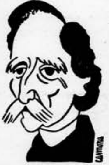
Sube la marea...