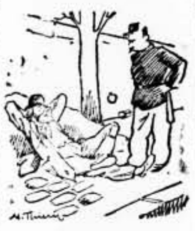
—Como que no quiero trabajar? Estoy esperando la instalación de nuevas industrias.

La Sociedad Internacional para el esfuerzo cristiano, el Consejo Nacional de Mujeres Norteamericanas y la Asociación de Prensa Religiosa.—Fabra. UN PERIODICO DE NUEVA YORK, DICE QUE NO PUEDE, EN MODO ALGUNO, SER BORRADOS DEL ESPIRITU HUMANO ESTOS ACONTECIMIENTOS Nueva York, 16.— El periódico "New York Staats Zeitung" y "Herald", el más antiguo diario de lengua alemana que tira 70.000 ejemplares, se pronuncia contra los desórdenes de Alemania, mientras que hasta el presente se limitó a combatir las tesis oficiales del terror "Reich". El periódico escribe, entre otras cosas: «Los terribles acontecimientos de estos últimos días, no pueden, en modo alguno, ser borrados del espíritu de la Humanidad. Las esperanzas que habíamos formado, se han hundido. Protestamos contra estos poderes de hiena que en pocas horas han bajado las cortinas sobre sus más bajas instancias contra un Pueblo sin defensas.—Fabra.