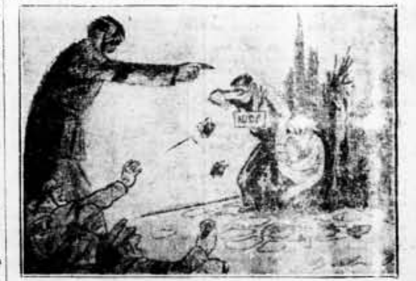
—Como se civiliza a una raza