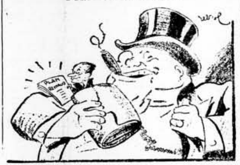
—Ahora, damos mis garantías, y toma sus botas.