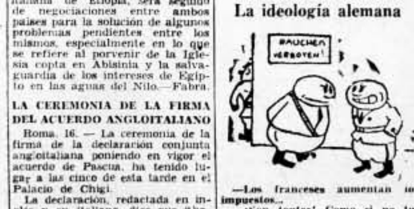
—Los franceses aumentan los impuestos... Son tantos! Como si no tuvieran judíos en el país...