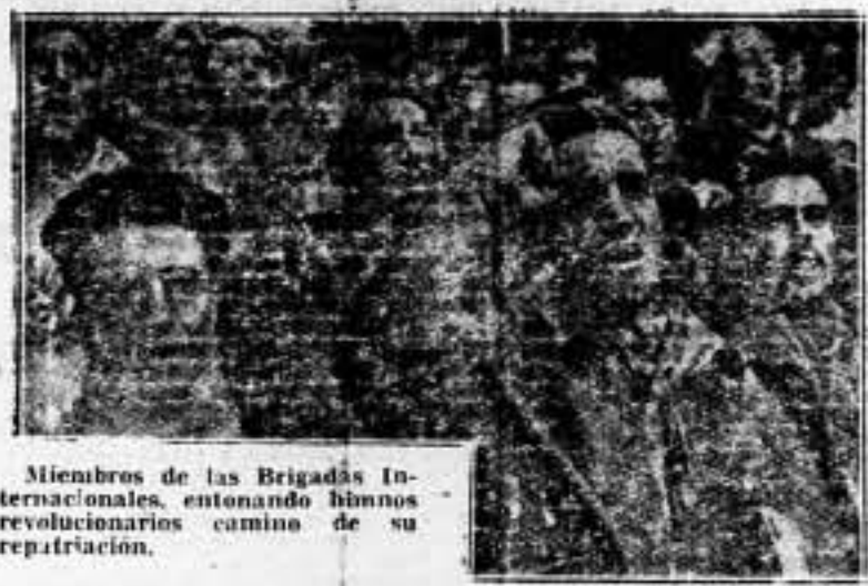
Miembros de las Brigadas Internacionales, entonando himnos revolucionarios camino de su repatriación.