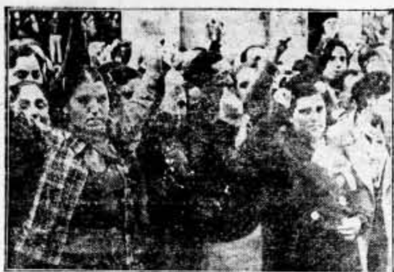
El Pueblo, emocionado saludando el paso del féretro que conducía el cadáver de Durruti

Los dioses ya han muerto. Pero el culto de los héroes será perenne... Y gracias a él, los pueblos hallarán siempre en sí mismos reservas individuales para mostrar el espectáculo de grandezas colectivas que hoy hace de nuestra España, en lucha contra la barbarie fascista, un pueblo de héroes sublimado en el dolor y en el sacrificio.