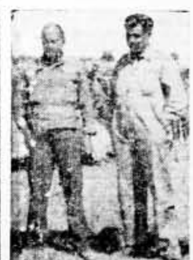
DURRUTI Y MANZANO en el frente de Aragón.

El Pleno aprobó el voto de confianza que el camarada Maldonado, del Pleno Nacional de la Industria del Transporte Marítimo y Fluvial, que tuvo lugar el día 10 y siguientes del actual.