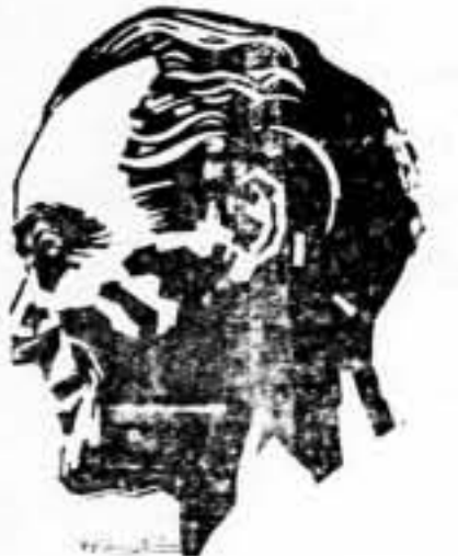
JUAN GARCÍA OLIVER

Por la tarde, se proyectarán los reportajes "Entierro de Durruti" y "20 de Noviembre".