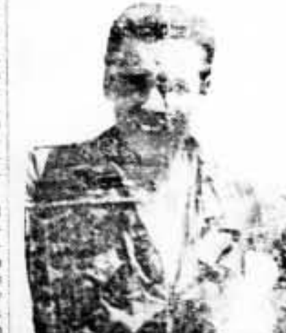
MIGUEL, que con Durruti compartió la lucha en todos los frentes de guerra