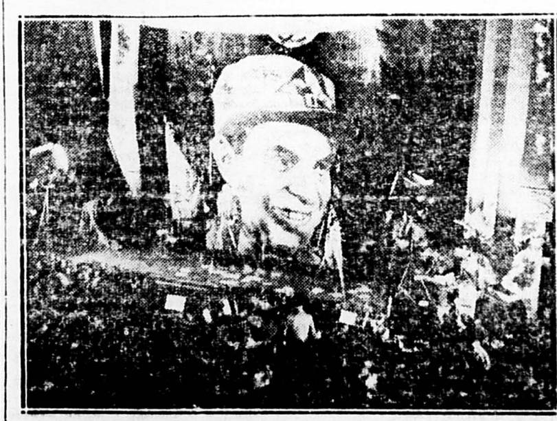
Aspecto del Monumental Cinema, de Madrid, en el que se celebró en memoria de Durruti, por la Comisión de Propaganda del Movimiento Libertario.

EDITA EN PARIS UN GRAN PERIODICO, "S I A", ORIGINARIO DE LA INSTITUCION Hemos recibido el primer numero de "S I A", editado en Paris, en tres idiomas y con abundante informacion grafica. Patente es la importancia adquirida en poco tiempo por esta entidad internacional antifascista, a la cual se han sumado, a millares, los hombres de espiritu liberal y democrático, estrechamente abrazados y fundidos con el proletariado del Mundo, principal sostenedor y alentador de Solidaridad Internacional Antifascista. La obra ingente desarrollada por esta Asociación, en cuyo éxito convergen tantas voluntades, necesitaba, como complemento, un órgano periodístico desde el cual pudiera S. I. A. realizar campañas divulgadoras de sus proyectos y recoger, asimismo, las inquietudes, los avances espirituales de los antifascistas del Mundo entero, sin limitarse, como en el pasado, a las ideas reaccionarias, sociales y políticas de sus colaboradores. Respondiendo a esa ineludible necesidad, ha visto la luz pública en Paris el periódico "S I A", en cuyo primer número se presta, preferente atención, a la situación de España. El periódico es, desde todos los puntos de vista, un órgano digno de la gran Institución de que es vocero. Y sus campañas, que están en marcha, en todo instante, saturadas de las ideas que la Institución encarna, le asegurarán un enorme público en todos los países del Mundo, libres de las garras de las Dictaduras.