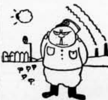
— Como me encuentro aburrido, voy a ir a la casa de Judas...