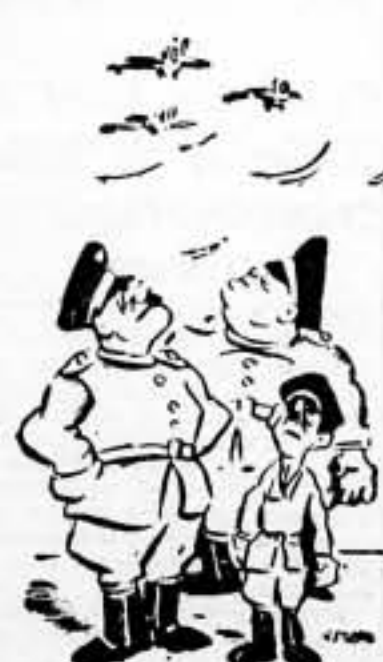
— ¡Oye Otto, también Inglaterra tiene aviación!

Londres, 25. — El número de diputados liberales y laboristas que se reunieron anoche en telegrama a Chamberlain protestando de la intensificación de los bombardeos contra la población civil de Barcelona y pidiendo al primer ministro que se niegue a conceder los derechos de beligerancia a los responsables de tales atrocidades se eleva a 46. Además de los nombres ya mencionados, entre los firmantes del telegrama figuran Lloyd George y Mander. — Agencia España.