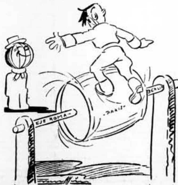
— Me parece que con este «oje» ya no cogeré el Mundo!