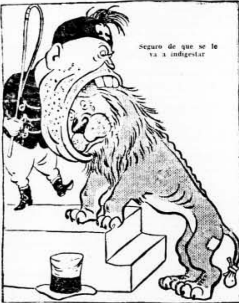
Seguro de que se le va a indigestar