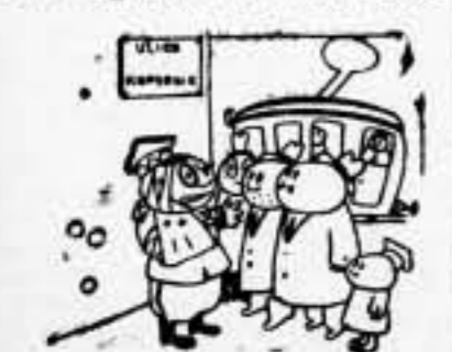
...Y entonces la población nos hizo una recepción entusiasta...