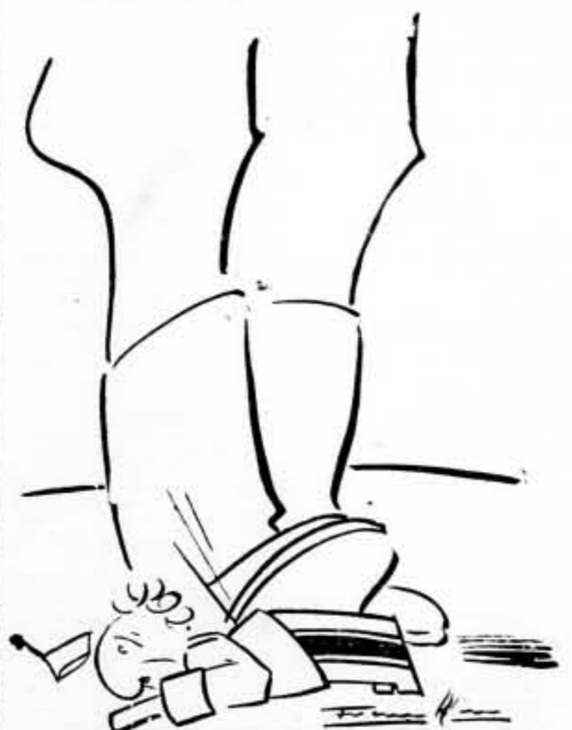
— ¡V pensar que soy el "generalísimo"!

En cuanto a la finalidad que con su edición se persigue, nosotros la agradecemos con toda el alma, no solo por la ayuda material que pueda representar para los periodistas y obreros de las Artes Gráficas, sino, principalmente, por la emocionada prueba de afecto y de solidaridad, que todos los que han intervenido en la edición, nos dan en esta hora difícil, en la cual, sobre la España antifascista y revolucionaria, se concitan los bastardos intereses de una Europa en decadencia, que se obtiene en ahogos para que sobrevivan los privilegios de clase y las oligarquías castas.