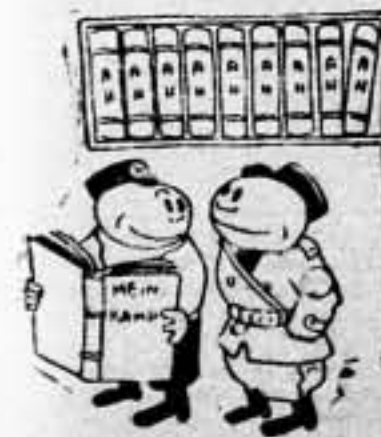
—¡Vaya ganancia! No lo sabe de memoria!

(La página del "Mein Kampf" sobre Francia, será corregida).