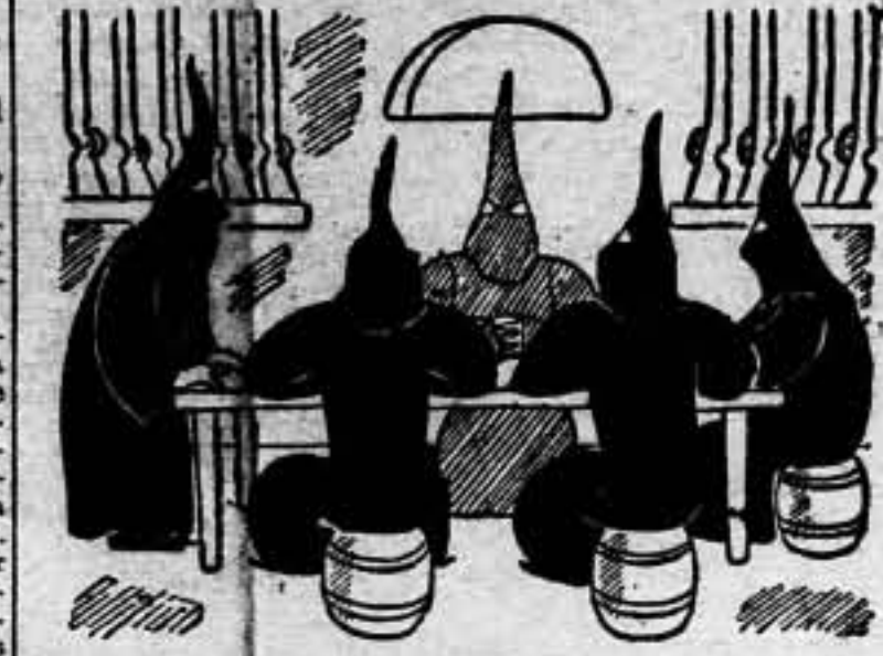
—La verdad es que, si nosotros estuviéramos en la cárcel, ¿dónde meterían a los otros?