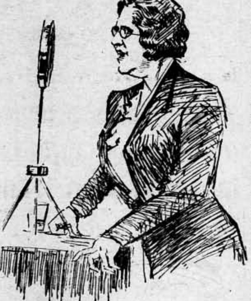
El ideal de la grandeza y de la independencia total de una España, redimida de la miseria, de la ignorancia, del feudalismo político, económico y religioso...