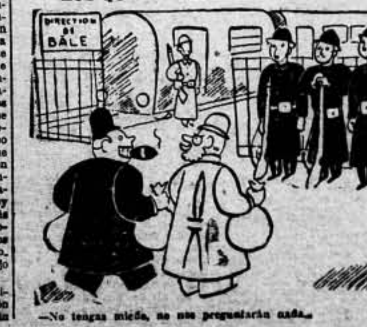
—No tengas miedo, no nos preguntarán nada.