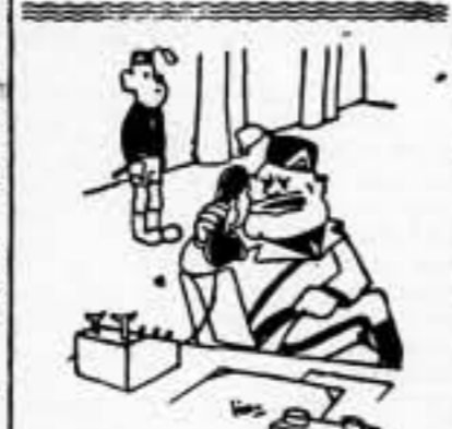
—¡Aló!... ¡Adolfo!... ¿Qué pide también algo de dinero para gastos generales?

DEMÁS FRENTE. — Sin noticias de interés.