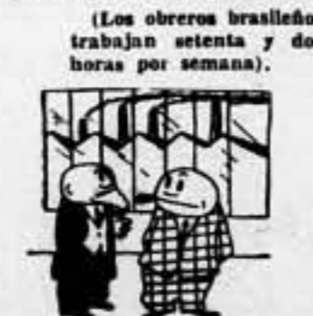
(Los obreros brasileños trabajan setenta y dos horas por semana). —Pues eso es lo que impondría, mos en Europa si triunfara el fascismo.

Washington, 12. — La conferencia en pro de la democracia panamericana, se ha pronunciado en favor de su incorporación a otros grupos similares, dentro de las líneas generales favorables a la Democracia Internacional. En las conclusiones votadas por conferencia, son condenadas "s" ramente las tentativas efectuadas por los países totalitarios, tentativas encaminadas a dominar también en los pueblos latinoamericanos. La resolución final, entre las adoptadas, recomienda una enérgica y decidida cooperación con los regimenes de los pueblos democráticos. — Fabra.