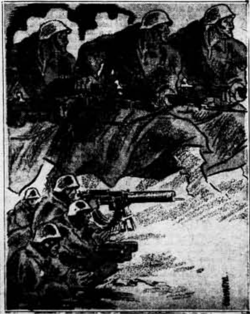
Pregados en el suelo no cediendo ni un palmo de tierra al invasor

Moscú, 12. — Los círculos soviéticos siguen con gran interés la evolución de la situación en Memel, considerándose como muy probable la unión del territorio de Memel a Alemania. Los mismos círculos hacen prever una denuncia del Pacto soviético-lituano, en caso de modificación de la política de este país.—Agencia España.