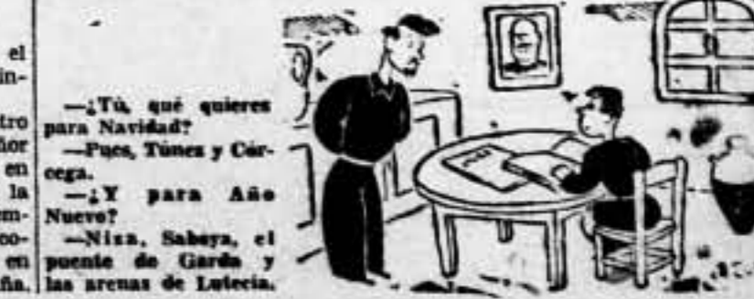
—¿Tú, qué quieres para Navidad? — Pues, Túniz y Cárcoga. — ¿Y para Año Nuevo? — Niza, Sabaya, el puente de Gard y las arenas de Lutecia.