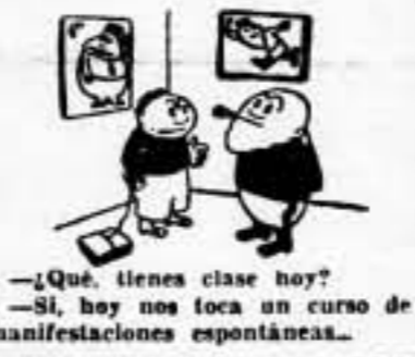
—¿Qué tienes clase hoy? —Sí, hoy nos toca un curso de manifestaciones espontáneas.