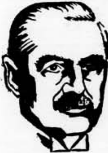
De la Asociación de la Prensa extranjera en Londres.

Londres, 12. — El muestro de la opinión inglesa y de los círculos políticos, será eliminado por el discurso que pronunciará el primer ministro, Chamberlain, de 9 a 10 de la noche le mañana. Las radios inglesas transmitirán el discurso que el Sr. Chamberlain pronunciará en el banquete