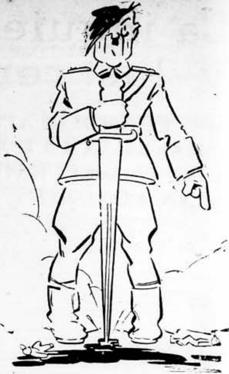
— Los hombres se deben al Estado. ¡Y el Estado soy yo!