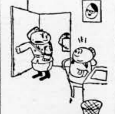
—¿Tienes el texto de la declaración francoalemana? —¡Bah! dispénsame, lo había tirado ya al cesto de los papeles.