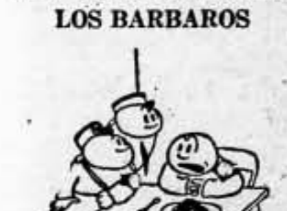
—¡Y abajo están comiendo pan con manteca verdadera!