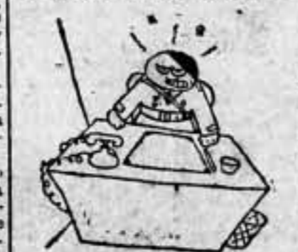
—Si yo supiera qué me telefonean todas las mañanas, llamaría: «Buenos días, judío asqueroso!»