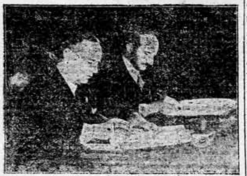
El emisario de Hitler, von Ribbentrop, y el ministro de Relaciones Exteriores de la República francesa, firman, con expresión solemne, la declaración de amistad francoalemana. Jamás un documento de esta especie ha dado menos garantías y satisfacción a los amantes de una paz verdadera.