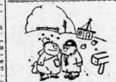
—¿Y qué contestará Francia a nuestras legítimas aspiraciones? —No enviará al general Chamberlain...

EJERCITO DE TIERRA. —Sin novedad importante que consignar en los distintos frentes. AVIACION. —En las primeras horas de la tarde de hoy, varios aparatos "Junker III" han bombardeado el pueblo de Mataró, ocasionando algunas víctimas entre la población civil.