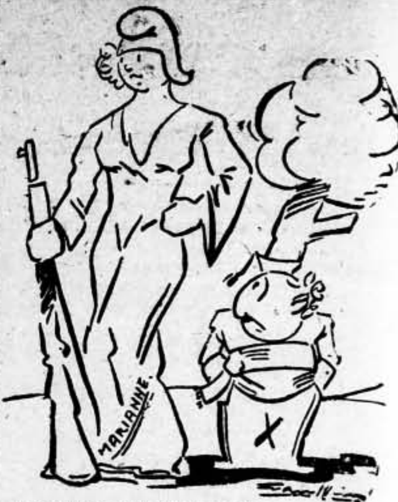
—Es demasiada mujer para dos tontos!