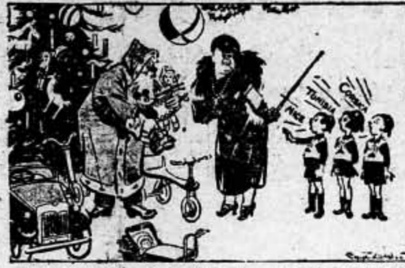
Mama Mussolini. — A ver niños, déixalo ir. Mago, que queréis para Pascuas.

Varsovia, 15. — A pesar de los mentis oficiales, se asegura en los círculos diplomáticos que Litvínov llegará próximamente a Polonia. Se asegura que su visita ha sido fijada para mediados del próximo mes de enero. Hoy salió la misión polaca para Moscú, con objeto de continuar las conversaciones comerciales. El ministro de Comercio polaco se encuentra ya en la capital soviética, habiendo sido recibido en el Comisariado de Negocios Extranjeros.—Agencia España.