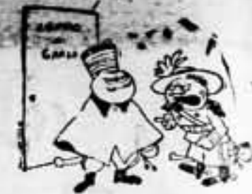
— ¡Si rechazas darnos Villa de... dices, reclamaremos la Viena de... Mito!