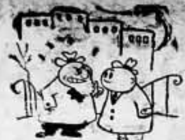
— ¡Tú eres en las filas de Franco! — Claro, todos ellos lo son...