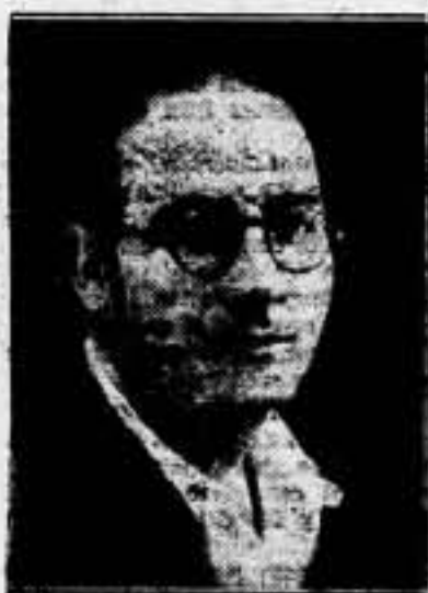
al Poder, y representadas en el Frente Popular. Además de insensatez, sería impolítico, por lo que podría significar de coactivo para quien secestra de todo el prestigio moral que da la libre autodeterminación en el orden de prerrogativas responsabilidades en el Poder.

Quien ame a la República y quien ame a Cataluña, sin particularismos, quien vea claro, obrará de acuerdo con estas normas. La lección de fuerza política la da el Movimiento Libertario. Y de cara al exterior, y al interior, que se aprecie si puede seguir beneficiando a Cataluña y al Gobierno de la Generalidad el hecho de que malevolamente, y con visos de confirmación real, no pueda considerarse a éste como auténtica expresión de democracia antifascista de toda Cataluña. De toda Cataluña, de la que forman parte la C. N. T. y el Movimiento Libertario, con la balanza inclinada a lo que más se especula contra nosotros más allá de las fronteras de España. Y conste que los anarquistas tenemos bien definida, desde siempre, nuestra posición sobre el Poder, sin olvidar que una cosa son los principios y otra la exigencia apremiante de las realidades.