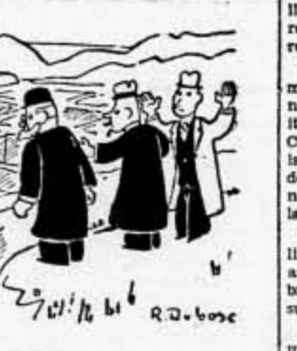
Son vestigios de un pueblo galorromano.

¡Callate! Si lo sabe Mussolini, lo reclama.