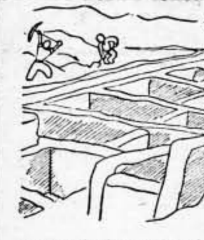
Son vestigios de un pueblo galorromano.

¡Callate! Si lo sabe Mussolini, lo reclama.