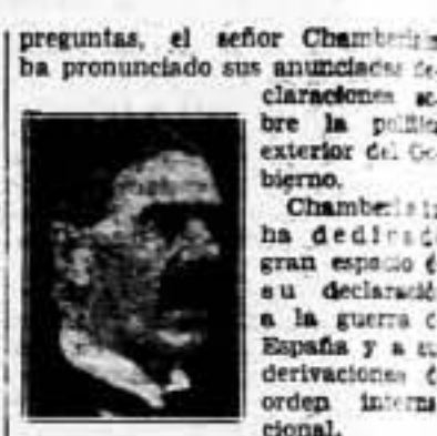
En síntesis, el señor Chamberlain ha dicho: «Por lo que se refiere a la cuestión de la concesión de los derechos de beligerancia, mientras haya en España tropas extranjeras y