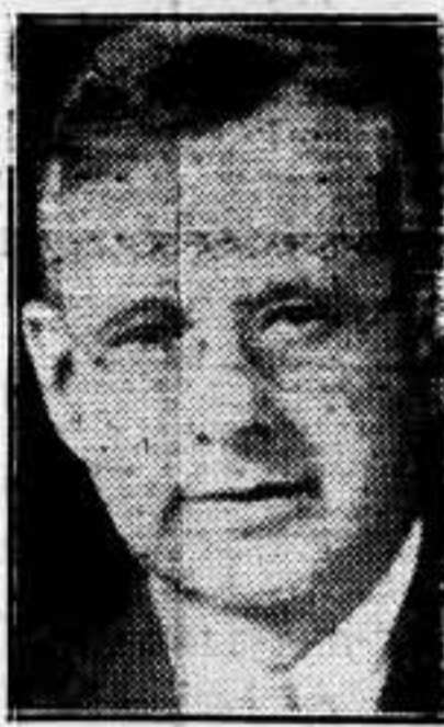
4.º Encuesta sobre las actividades de la titulada Liga Germano-norteamericana para la incrementación de los negocios que financian la propaganda nazi, con fondos norteamericanos. — Fabra.

— Por los clavos de Cristo, dame seguidor el Memel como regalo de Pascuas... —