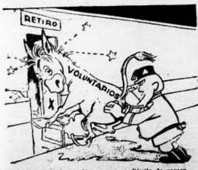
—Me pare que cuesta —mucho e un poco difícil de pasar.

siendo muy viva, y los diarios franceses recuerdan, a propósito de las pretensiones italianas sobre concesiones coloniales y de la denuncia del Convenio de 1935, que Italia recibió de Francia, con los acuerdos Laval-Mussolini, los oasis del Ghat y del Guadamés, 100.000 kilómetros cuadrados de territorio en el Tibesti, 1.500 en la Somalia francesa y la isla de Dalmatín, y 2.500 acciones en el ferrocarril de Djibuti a Addis-Ababa. De Inglaterra recibió Italia el Ciubland. Francia no tiene nada que dar a Italia, y si ésta quiere denunciar el Convenio de 1935, habrá de renunciar a las concesiones hechas por Francia. — Agencia España.