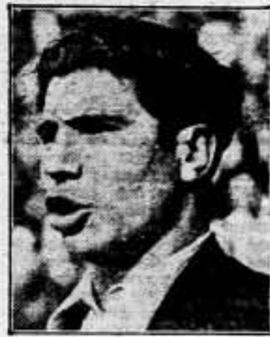
Hemos de ocuparnos con seriedad de nuestro trabajo en el futuro, para que de él el rendimiento máximo, a fin de vencer las enormes dificultades que se nos presentan después, en la postguerra.

Hay que apartar de la mente todo cuanto pudiera significar que, después, al terminar esta contienda, pudiera haber una nueva batalla por el predominio y el Poder. La guerra está ocasionando demasiados sacrificios, demasiados dolores, y hay que partir del principio de que de igual forma que hoy actuamos conjuntamente ideas y organismos diversos, unidos para vencer el enemigo común, de igual forma llegaremos mañana a una inteligencia que signifique la colaboración mutua para una convivencia civil.