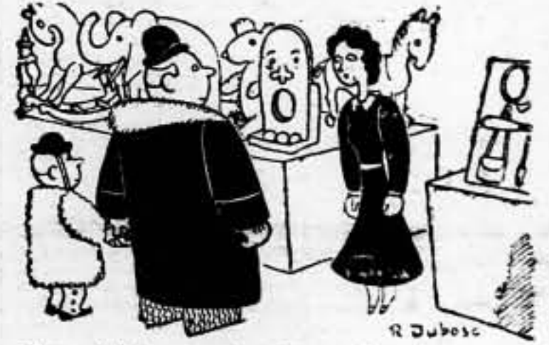
—Deme usted dos cañones, tres tanques y cinco aviones.