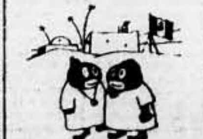
Parroco que el... que...

Ginebra, 30. — El Comité de Economía de la Sociedad de las Naciones, acaba de hacer público su informe, en el que pide que se proceda a una reducción de un 20 por 100 del presupuesto general de gastos.