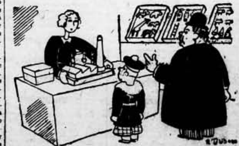
—Con la táctica, póngame usted una cárcel para encerrar a los obreros burgueses.