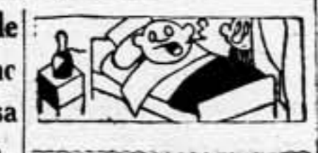
El señor Daladier regresó a Francia

Budapest, 6. (Urgente). — En los medios gubernamentales de Budapest, consideran resuelto el incidente fronterizo de Munkacs. El embajador húngaro en Praga, ha visitado al ministro de Negocios Extranjeros de Checoslovaquia. Se sabe que el Gobierno checoslovaco ha lamentado el incidente, y ha propuesto la formación de una Comisión de encuesta. Aunque el incidente ha de ser de gravedad, parece que no ha tenido la que en un principio se le ha atribuido, y puede ya considerarse resuelto. — París.