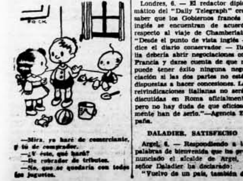
— Mira, yo haré de comerciante, y tú de comprador. — V ésto, qué hará? — Se cobrará de tributos. — No, que se quedará con todos los juguetes.

Londres, 6. — El redactor diplomático del "Daily Telegraph" cree saber que los Gobiernos francés e inglés se encuentran de acuerdo respecto al viaje de Chamberlain. "Desde el punto de vista inglés — dice el diario conservador — Italia debería abrir negociaciones con Francia y dar cuenta de que no puede tener éxito ninguna negociación si las dos partes no están dispuestas a hacer concesiones. Las reivindicaciones italianas no serán discutidas en Roma oficialmente, pero no hay duda de que oficialmente han de serlo." — Agencia España.