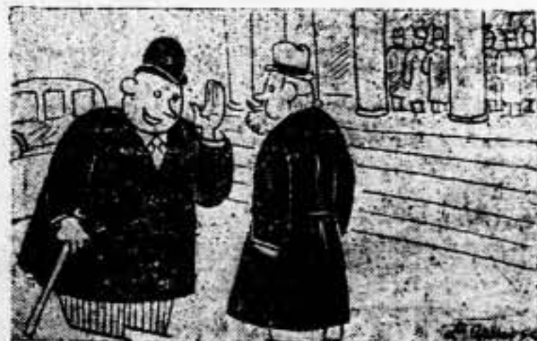
— Si quieres ganar dinero, compra acciones de alguna fábrica de hacer fichas de los sin trabajo; esas trabajan... —