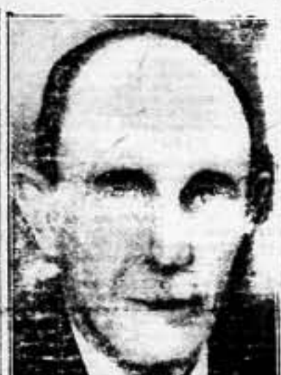
El primer ministro británico Chamberlain y lord Halifax embarcaron en Dover

Pero para de esas cuestiones se palpitan actualmente de inabarcable interés, otras hay que se refieren a la misma materia. Francia que a Inglaterra, así como Italia sería un obstáculo para la concertación de un arreglo, en cuestión, se prolongasen por bastante tiempo. No hay que olvidar que los ministros del Gobierno inglés van a Roma después de haber recibido un mensaje del Presidente de los Estados Unidos, y que las extensas líneas reivindicativas de Italia en África, han venido a virtud de la alianza de las relaciones anglo-italianas. Con referencia a la declaración del «Premier», se considera que Mussolini pudiera estar muy dispuesto a él, decidiendo la retirada de los efectivos ita-