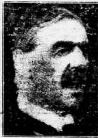
EL «PREMIER» ES DESPEDIDO AL GRITO DE «¡ARMAS PARA ESPAÑA!»

Londres, 10. — La salida de Chamberlain para París ha sido algo accidentada. Cuando el encargado italiano de Negocios acompañaba al primer ministro, un grupo de mujeres se encará con Chamberlain gritando: «¡Armas para España!», y un cortejo de parados, llevando un ataúd, se manifestó pidiendo que Chamberlain se ocupase de los parados y no de ayudar a Mussolini. La Policía se vio obligada a cargar muchas veces contra la multitud.