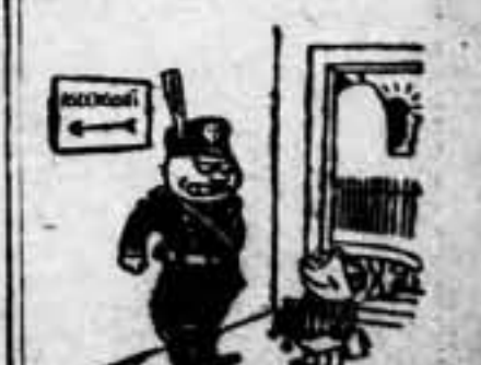
botones del accesorio... 403 88 monitores de la muerte...

El sacrificio es grande. Pero de mayor entidad ha de ser el fruto de este empeño colectivo.