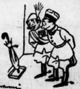
— ¡Pensar que esto sea entre el pliegue la paz o la guerra! —

Londres, 19. — El almirante Kerr, ha enviado una carta al «Daily Telegraph», pidiendo la formación de un Gobierno de coalición y de unión nacional para hacer frente a la situación. Todos los Partidos son favorables a este Gobierno de unión nacional; pero parece que Chamberlain sigue siendo contrario a ello. El Chamberlain reforma su Gabinete, sustituirá al ministro de Coordinación de la Defensa, Mackay, y al ministro de la Guerra, Bellah, que son los que encierran más oposición, pero se limitará a este cambio sin dar ninguna significación a su reforma ministerial. — Agencia España.