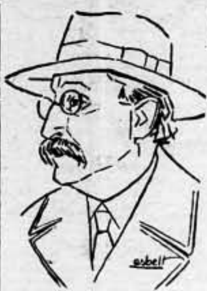
El secretario general de la C. G. T., Jouhaux, recordó que la Confederación luchó siempre contra la pretendida política de no intervención y destacó los peligros que ésta representaba contra Francia.

Paris 19. — Reducida por apremios de tiempo, a un telegrama de última hora, la reseña del acto de ayer en el Velódromo de Invierno, da ampliamos hoy, en atención a la importancia del acto, por la enorme concurrencia que congregó por la calidad de los oradores y por la claridad de los conceptos expresados en favor de la apertura de la frontera a la España Republicana.